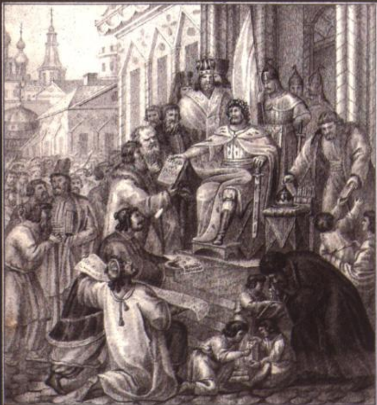
ЯРОСЛАВЪ ЗАКОНОДАТЕЛЬ 1019 - 1054

Ярославъ издасть письменные законы, подго- названіемъ Русской правды.