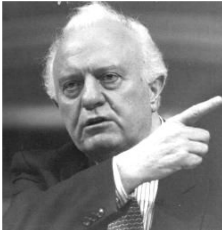
Министр иностранных дел СССР Э.А.Шеварнадзе.

Эти идеи были сформулированы в книге М.С.Горбачева «Перестройка и новое мышление для нашей страны и для всего мира».