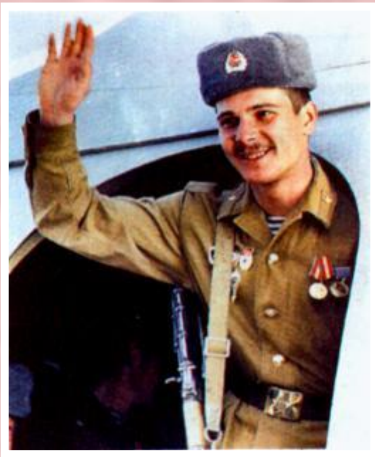
Советский солдат перед отлетом из Кабула.

Самой острой региональной проблемой для СССР была продолжающаяся война в Афганистане. В 1988 г. было заключено соглашение о прекращении американской помощи моджахедам и выводе из страны советских войск. 15 февраля 1989 г. последние советские части покинули Афганистан. Наши потери составили 14,5 тыс. человек убитыми, 54 тыс. - ранеными. Прекратилось советское военное присутствие в Эфиопии, Мозамбике, Никарагуа.