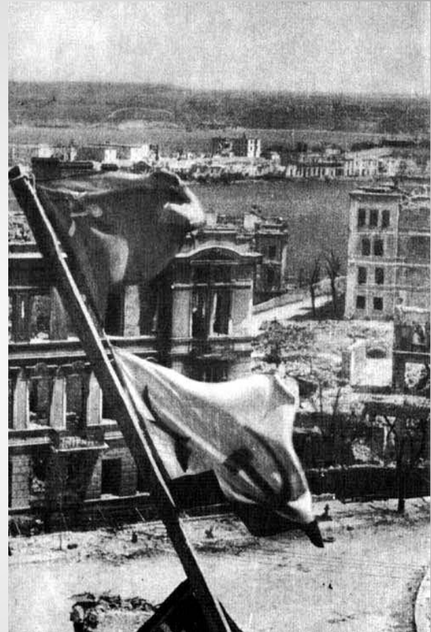
Над руинами города взвились Красные флаги победы. Севастополь, 1944 год

9 мая к вечеру был полностью освобожден Севастополь, 10 мая в час ночи Москва 24 залпами из 342 орудий салютовала освободителям города. В этот день газета "Правда" писала: "Здравствуй, родной Севастополь! Любимый город советского народа, город-герой, город-богатырь! Радостно приветствует тебя вся страна!". 12 мая в районе мыса Херсонес были разгромлены остатки фашистских войск в Крыму.