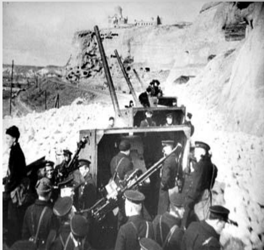
Бронепоезд выходит на позицию. 1942 год

В дни обороны жители города проявили ратный и трудовой героизм. Рабочие Морского завода под обстрелом врага ремонтировали корабли, создавали боевую технику днем и ночью, оборудовали два бронепоезда, построили и оснастили плавучую батарею № 3, получившую название "Не тронь меня", которая надежно прикрывала город от налетов фашистской авиации с моря. Немцы называли ее "Квадрат смерти". В горных выработках (штольнях) на берегу Севастопольской бухты были созданы подземные спецкомбинаты; № 1 - для производства вооружения и боеприпасов, № 2 - по пошиву белья, обуви и обмундирования. Тут же, под землей, работали амбулатории, столовая, клуб, школа, детские ясли и сад, а впоследствии - госпиталь, хлебозавод.