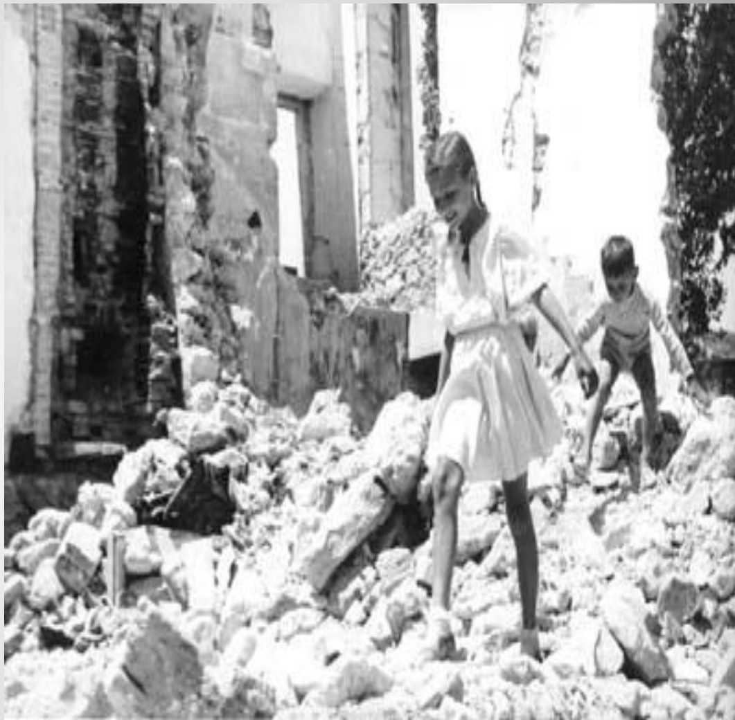
Весна 1942 года в Севастополе

В ознаменование подвига защитников города 22 декабря 1942 г. Указом Президиума Верховного Совета СССР была учреждена медаль "За оборону Севастополя", которой награждено свыше 50 тыс. участников обороны.