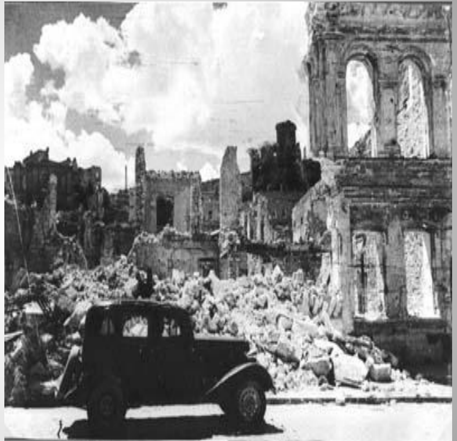
В разрушенном Севастополе 1944 года.

Защитников города постоянно поддерживали корабли флота. Прорываясь в осажденный Севастополь, они доставляли пополнения, боеприпасы, продукты питания, увозили на Большую землю раненых, стариков, женщин и детей, вели артиллерийский огонь по позициям врага. А когда надводные корабли уже не могли прорываться к Севастополю, их задачу отважно выполняли экипажи подводных лодок. Несгибаемое мужество и само отверженность проявили в дни обороны медицинские работники флота и города. За 8 месяцев обороны они спасли жизни десяткам тысяч людей, возвратили в строй 30927 раненых и 10686 больных.