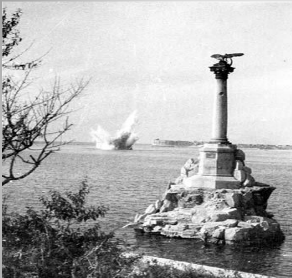
Взрыв немецкой мины на центральном рейде, 1941 год.

После провала попытки овладеть Севастополем с ходу немецко- фашистское командование осуществило три наступления на город: первое началось 11 ноября 1941 г., второе - 17 декабря 1941 г., третье - 7 июня 1942 г.