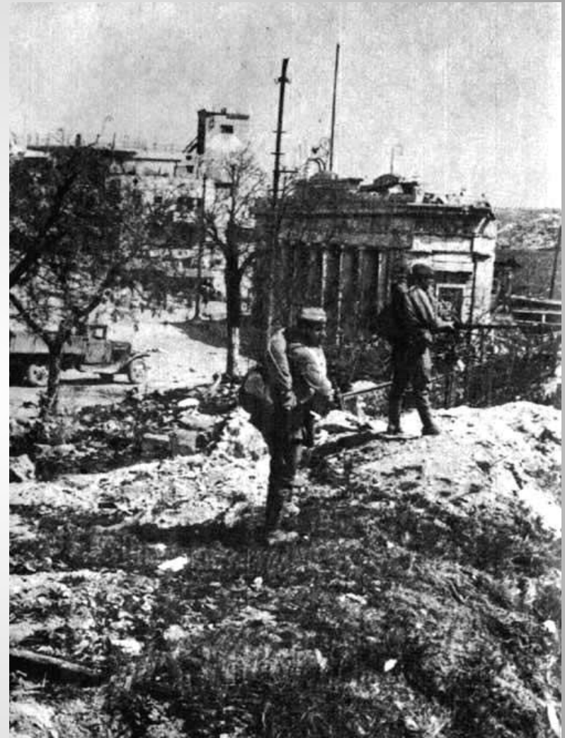
В городе тишина. Севастополь, 1944 год

Несмотря на жесточайший оккупационный режим, севастопольцы не прекратили борьбу с фашистами.