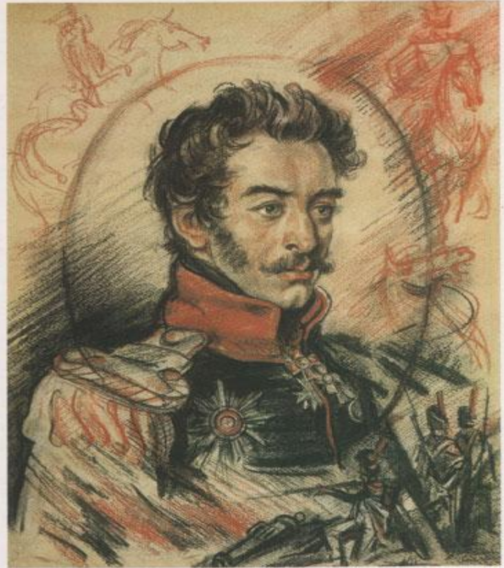
Сергей Григорьевич Волконский 1788—1865

• Волконский начал службу в 1806 году поручиком кавалергардского полка. Тогда же началась боевая жизнь в качестве адъютанта Остермана-Толстого.