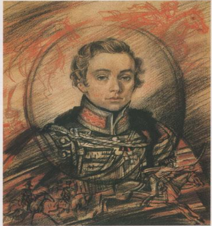
Надежда Андреевна Дурова 1783—1886

Нашествие Наполеона вызвало небывалый патриотический подъем в русском обществе. Во всенародную борьбу с захватчиками входили представители всех слоев населения. Сохранилась память и о героинях той поры.