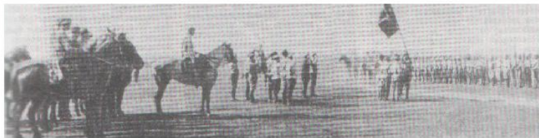
Вручение Красного знамени ВЦИК Латвийской стрелковой дивизии за участие в разгроме армии Деникина. Берислав, 2 августа 1920 года.