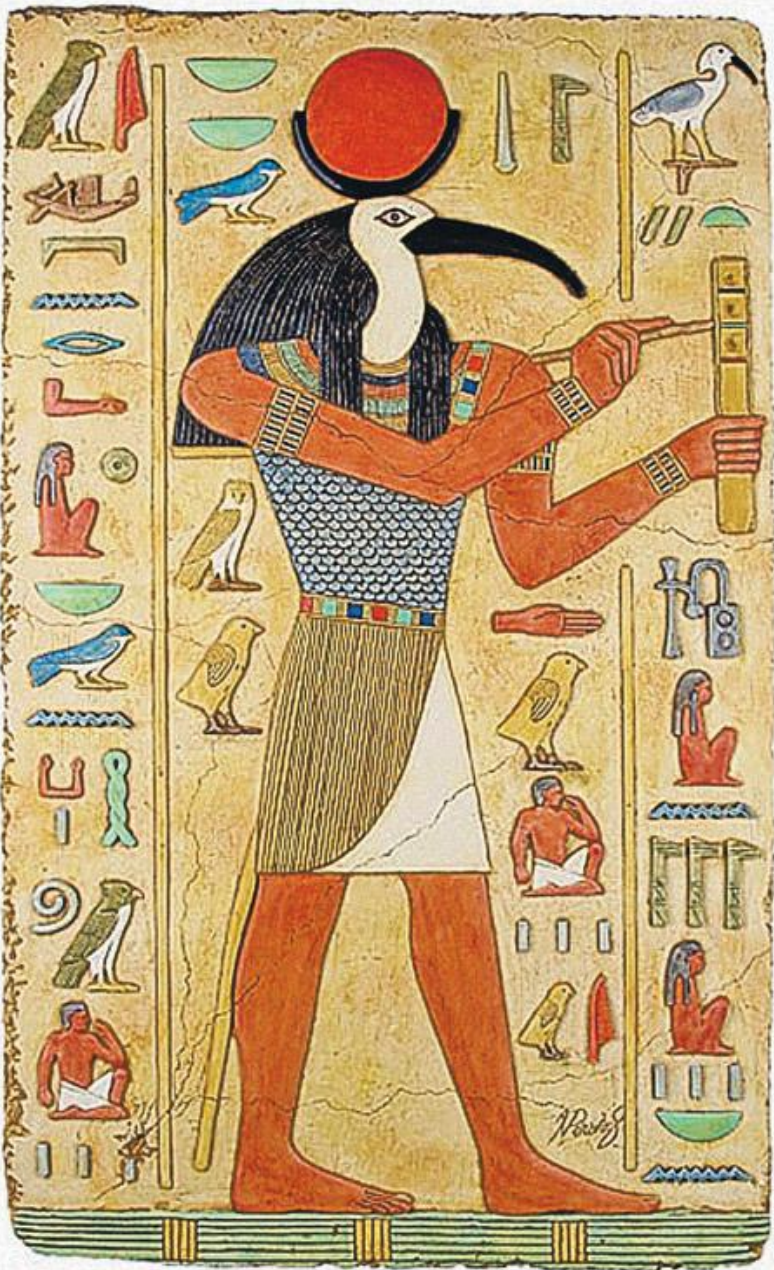
Бог Тот с головой птицы Ибиса