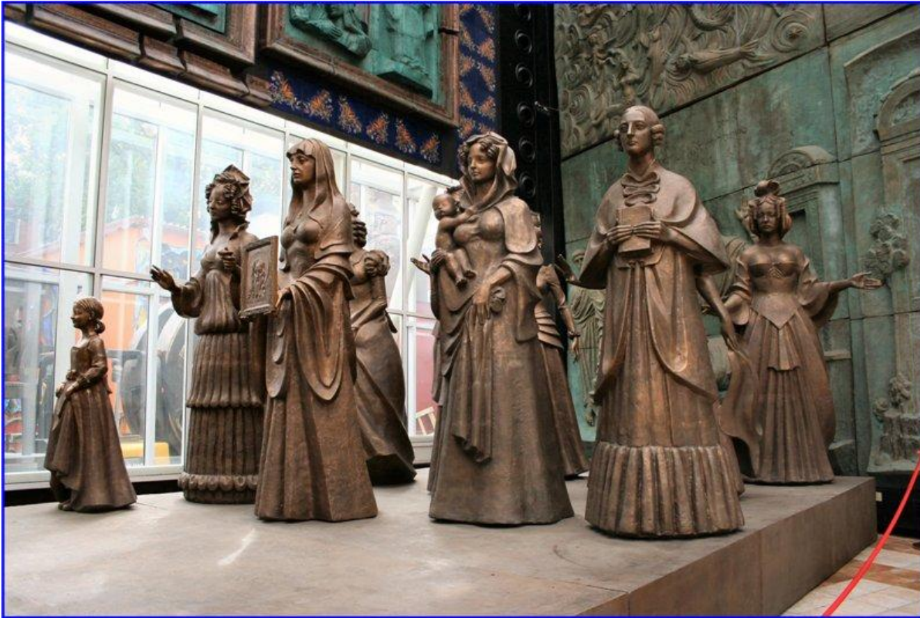
Зураб Церетели, скульптурная композиция "Жены декабристов. Врата судьбы"

Жены декабристов разделили участь своих мужей, совершив своеобразный женский подвиг. У каждой из них судьбы по-своему счастливы и трагичны. Каждой нелегко было оставить свою жизнь, иногда и детей, чтобы уехать за мужем.