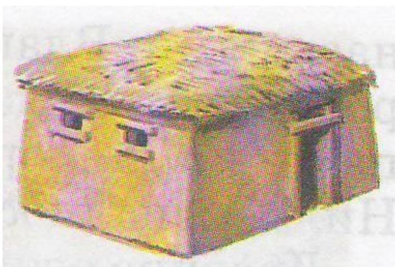
Хижина земледельца (рисунок нашего времени)