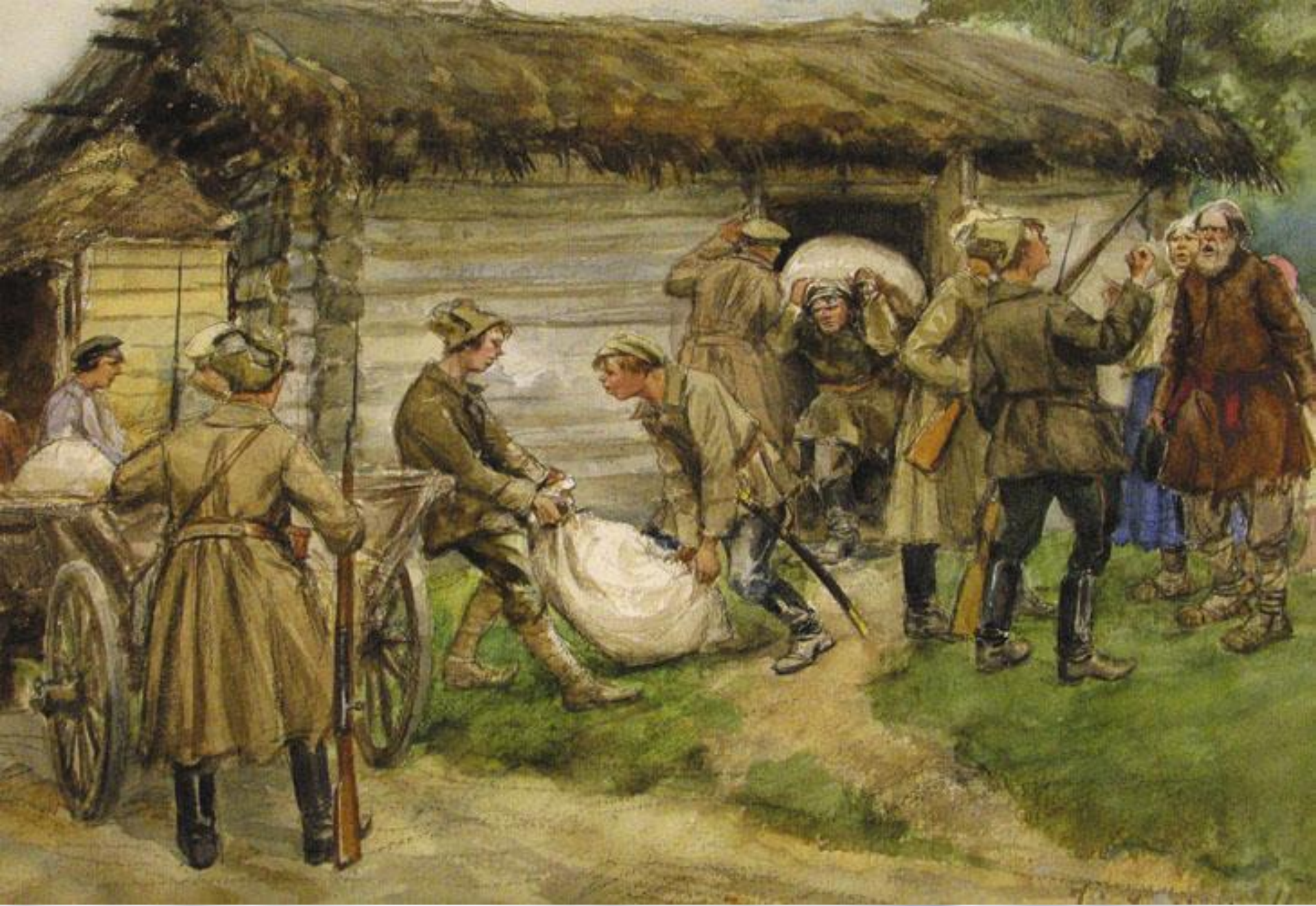
Семья «кулака» на выселение.