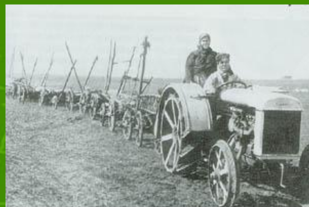
Новая техника на колхозных полях.