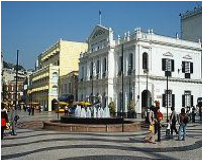
Исторический центр Макао