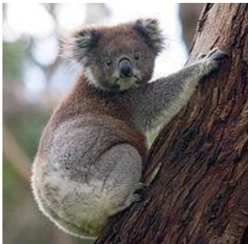
Коала на стволе эвкалипта