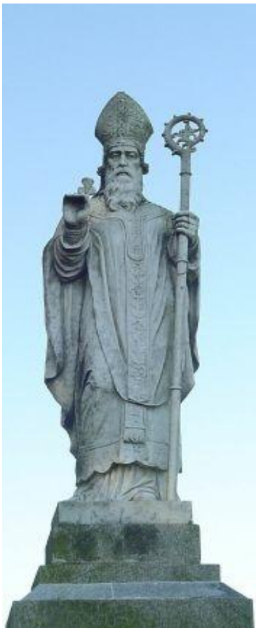
Памятник св. Патрику на холме Тара