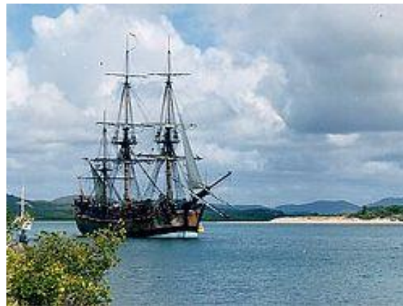
Копия корабля Д. Кук