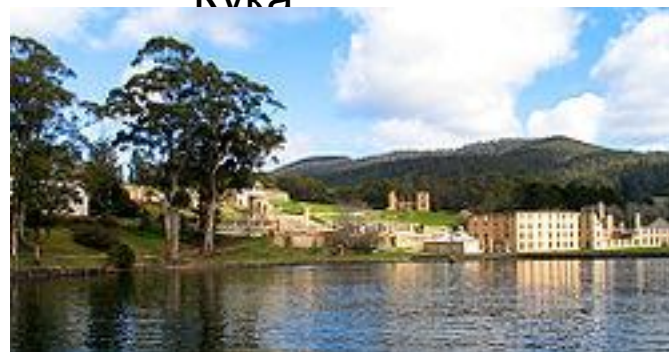
Порт-Артур на Тасмании был крупнейшей пересыльной базой преступников.