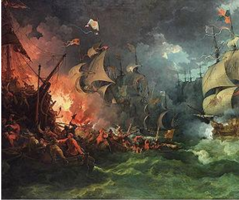
Гибель «Непобедимой Армады»