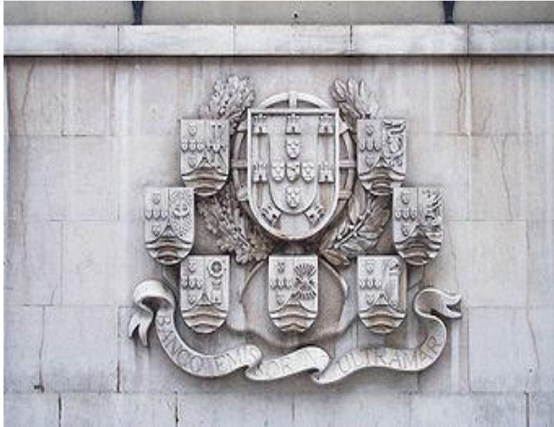
Герб Португалии в окружении гербов колоний

Великие географические открытия конца XV века, активная деятельность португальской знати и торговых элит привели к созданию крупнейшей морской империи нескольких следующих веков.