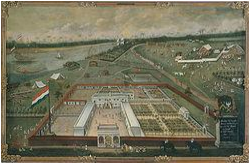
Фактория в Индонезии

Империя быстро расширялась и уже к XVIII веку включала в себя территорию Гвианы , Индонезии , фактории в Индии , на Цейлоне , Формозе и др. За свою историю Нидерландская империя включала множество территорий во многих частях мира. Она имела много соперников, главным из них была Британская империя .