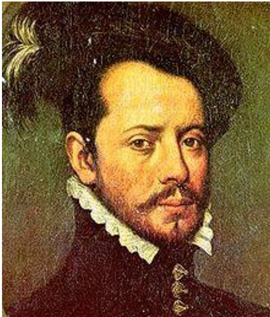
Эрнан Кортес- покоритель ацтеков

❖ Центром колонизации стал остров Эспаньола (Гаити).