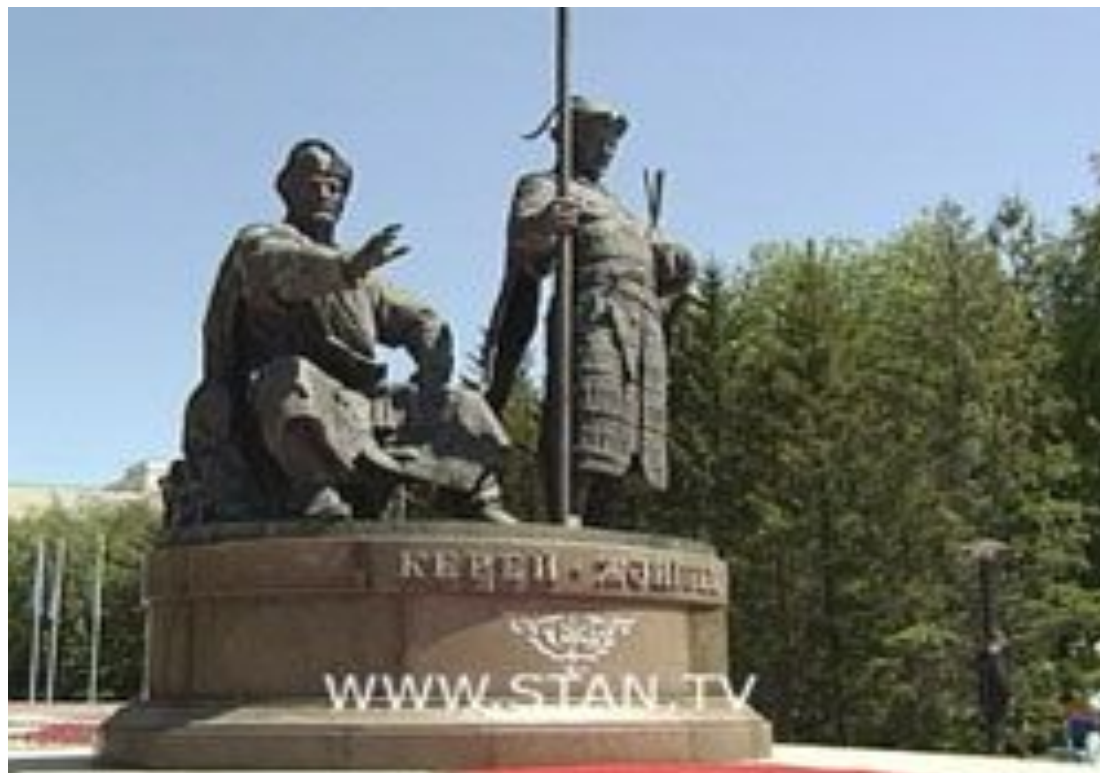
КЕРЕЙ-ХАН И ЖАНИБЕК-ХАН