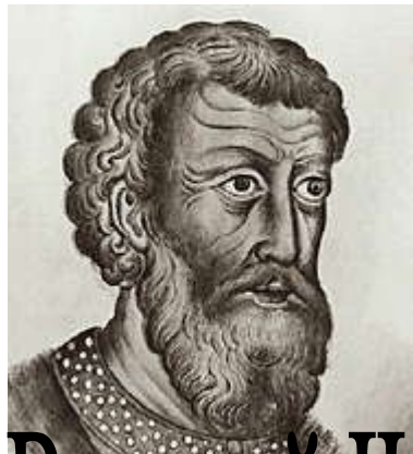
Василий II 1425-1462