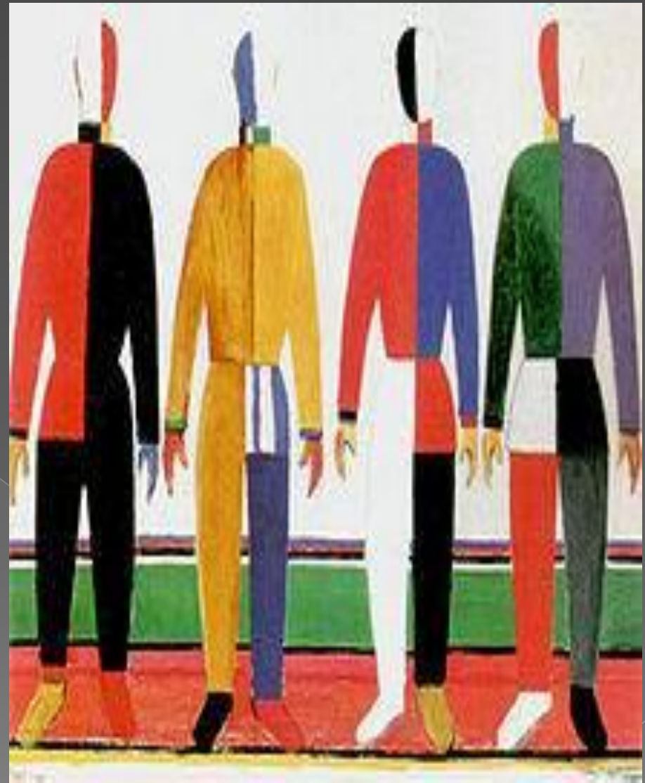
Казимир Малевич «Атлеты» 1933г.