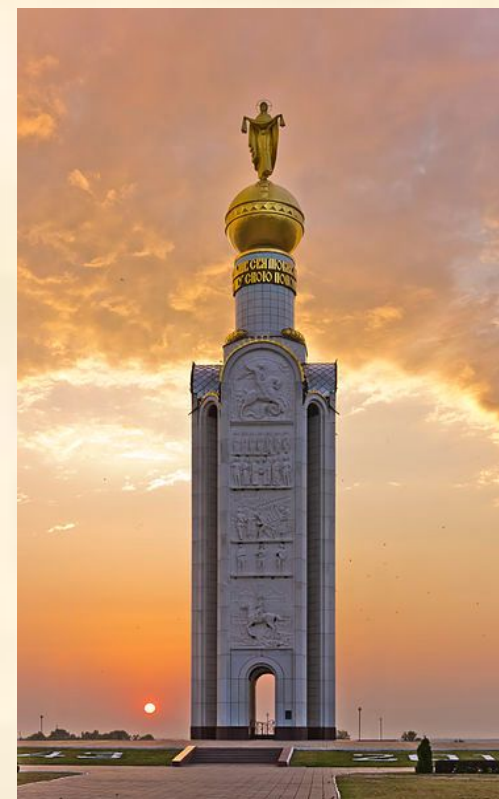
Звонница в память о погибших на Прохоровском поле