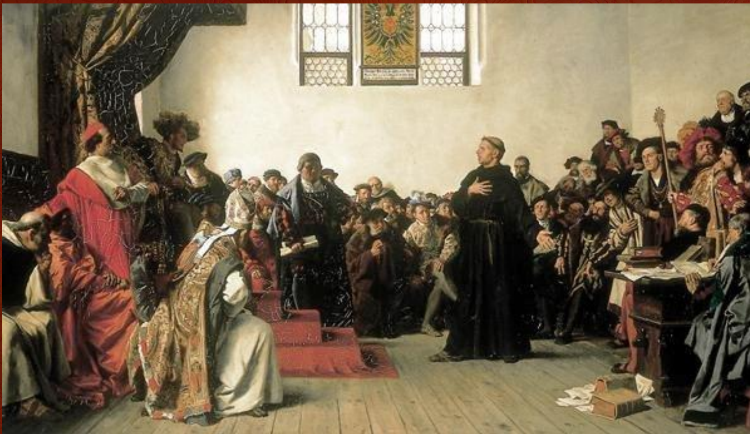
Бугенхаген проповедует на похоронах Лютера