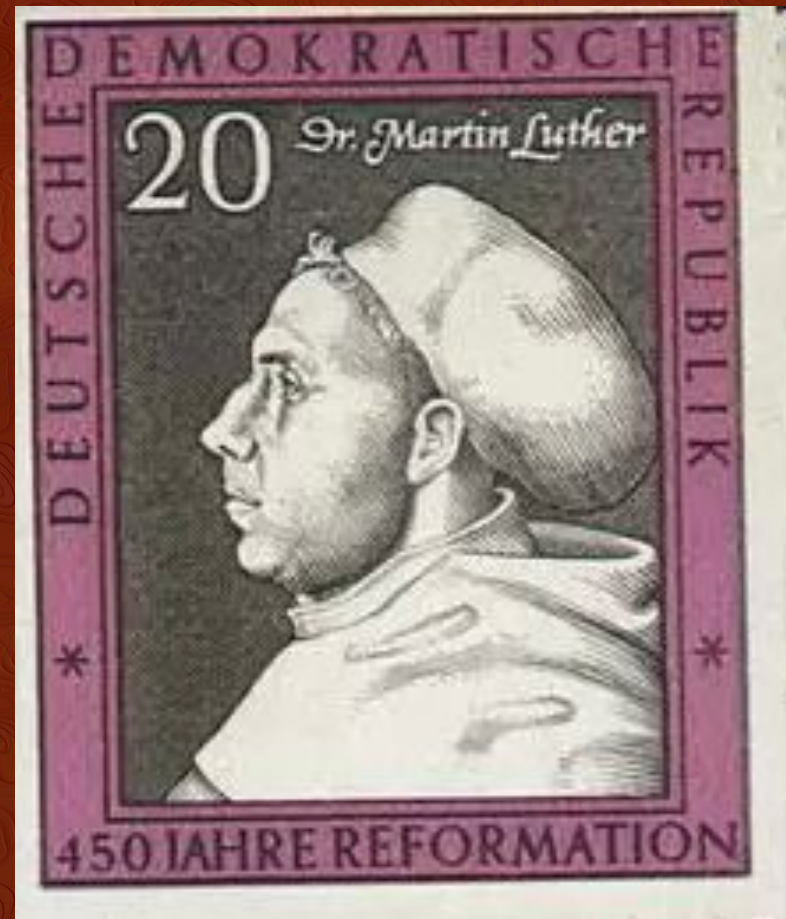
Почтовая марка ГДР