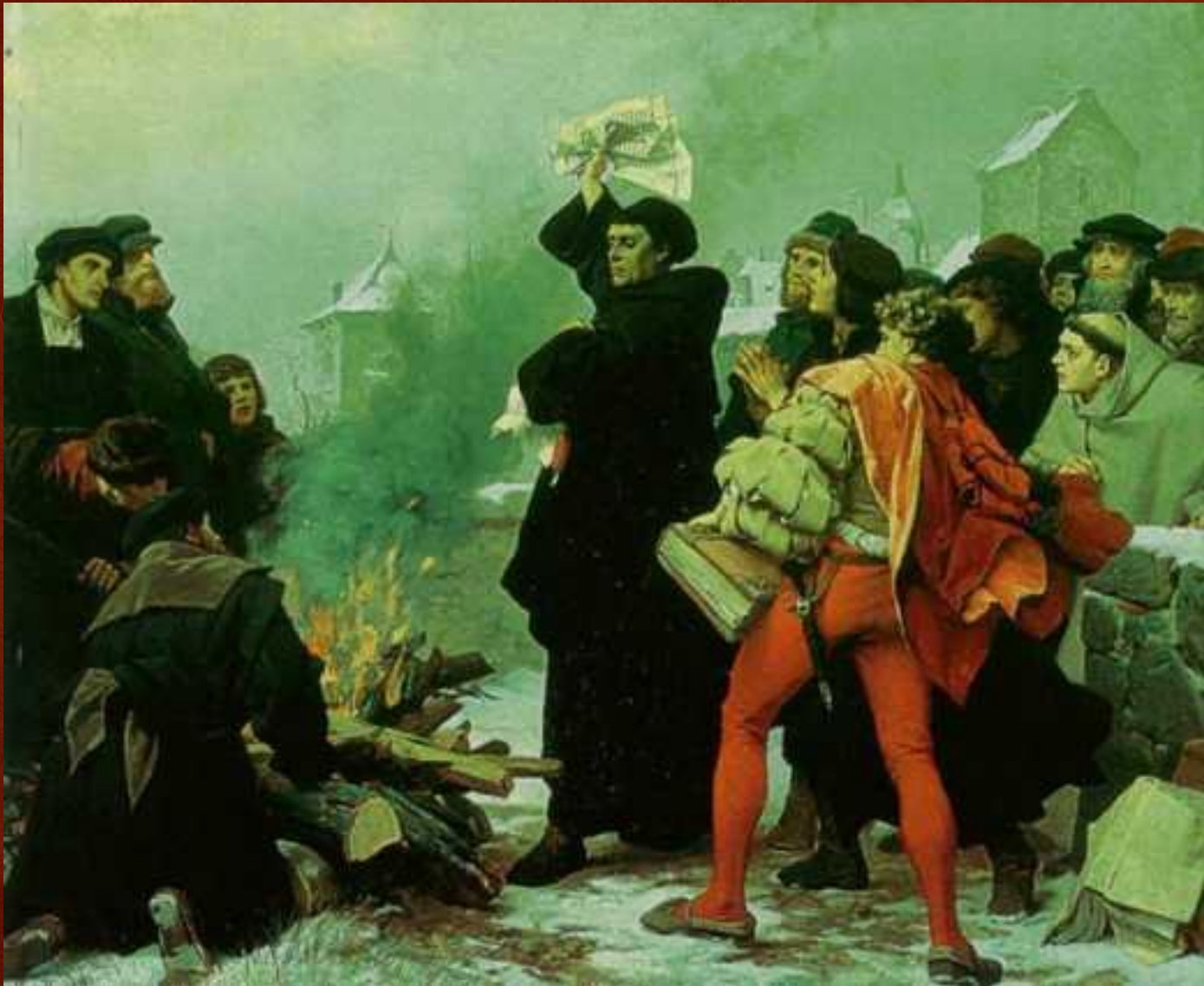
Мартин Лютер сжигает буллу 1520