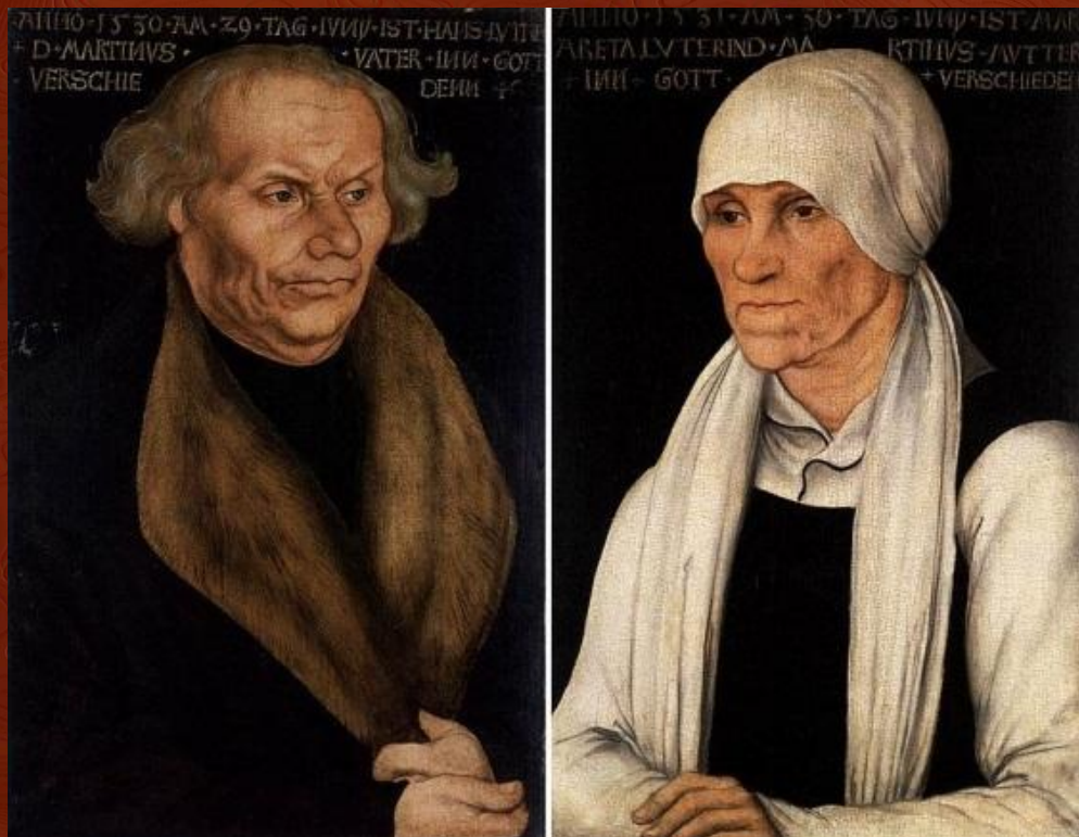
Лукас Кранах. Ганс и Маргарита Лютер

Мартин Лютер родился в семье Ганса Лютера (1459—1530) — бывшего крестьянина, перебравшегося в Эйслебен (Саксония) .. После рождения Мартина семья переехала в горный городок Мансфельд, где отец стал зажиточным бюргером