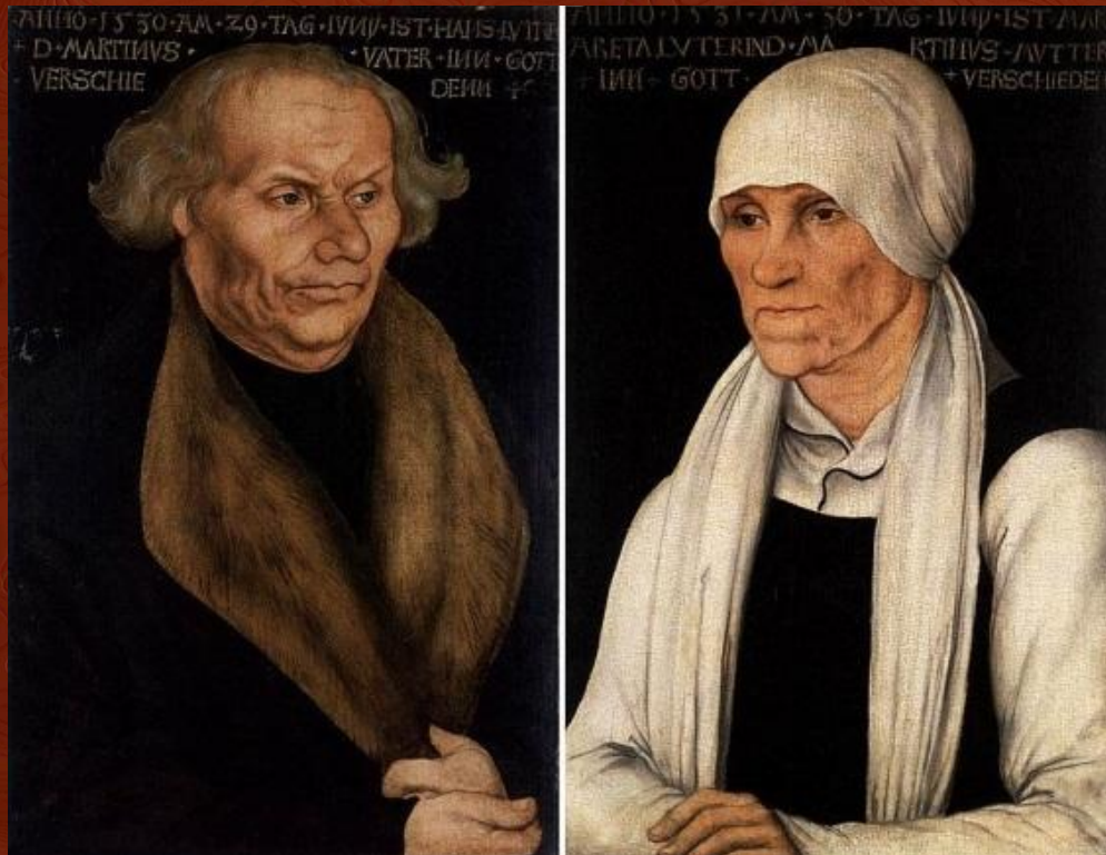
Лукас Кранах. Ганс и Маргарита Лютер

Мартин Лютер родился в семье Ганса Лютера (1459—1530) — бывшего крестьянина, перебравшегося в Эйслебен (Саксония) .. После рождения Мартина семья переехала в горный городок Мансфельд, где отец стал зажиточным бюргером