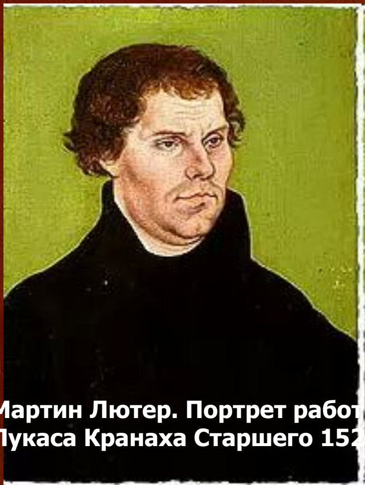
Мартин Лютер. Портрет работы Лукаса Кранаха Старшего 1526