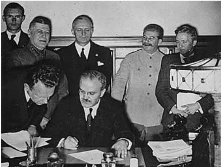
В. Молотов подписывает пакт о ненападении

3.1939 — Оккупация Чехословакии — протекторат Богемия и Моравия + Словацкое государство (фашизм)