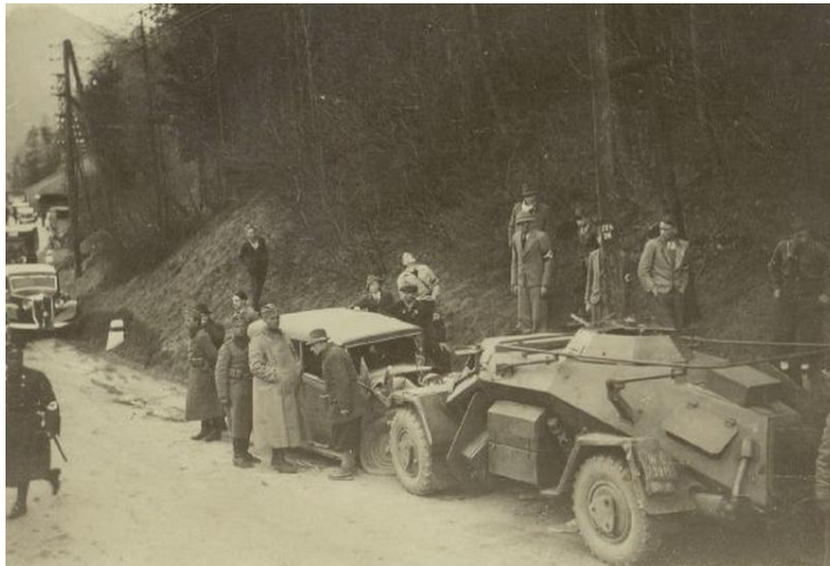
Немецкие войска в Австрии

1933 – Германия потребовала «равенства вооружений». Вышла из Лиги