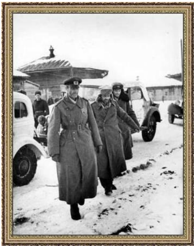
Плененный фельдмаршал Паулюс под Сталинградом

Советско-германский фронт Лето 1942 - Наступление вермахта на Сталинград.