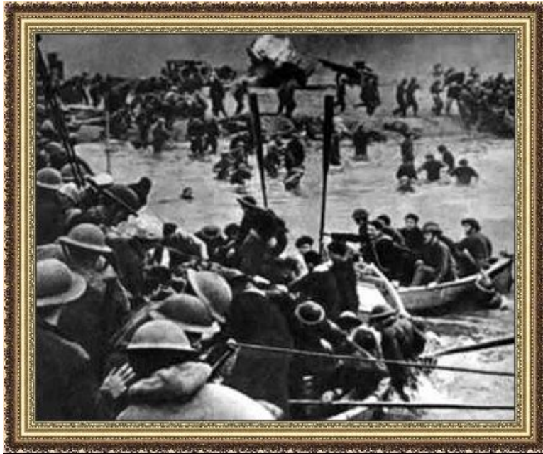
Эвакуация английской армии под Дюнкерком

«Странная война» Англия и Франция — трехкратное превосходство на западном фронте. Отказ от активных действий.