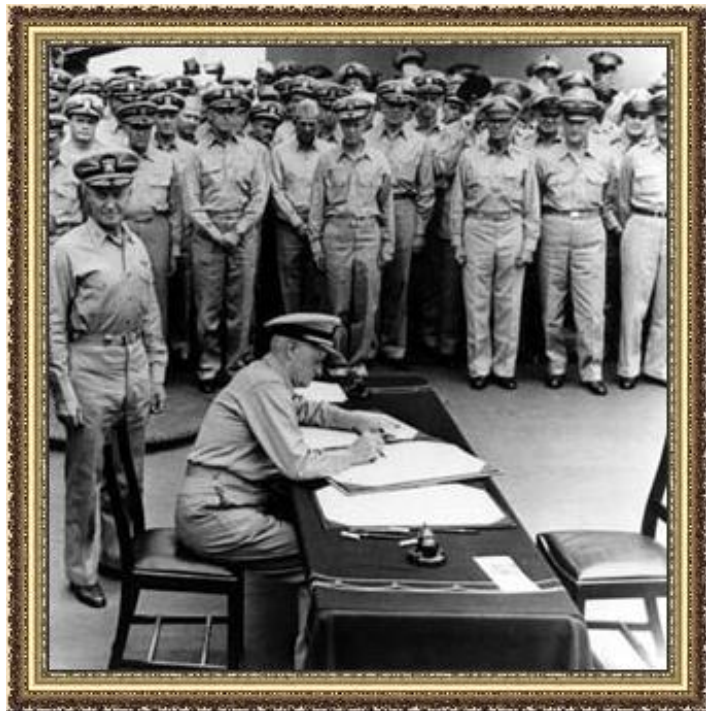
Подписание капитуляции Японии

1944 – Япония – захват территорий в Китае.