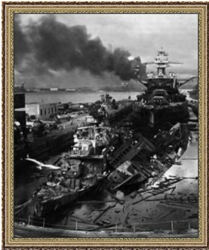
Американский авианосец после удара японской авиации

22.06.1941 - нападение Германии на СССР. Начало нового этапа войны.