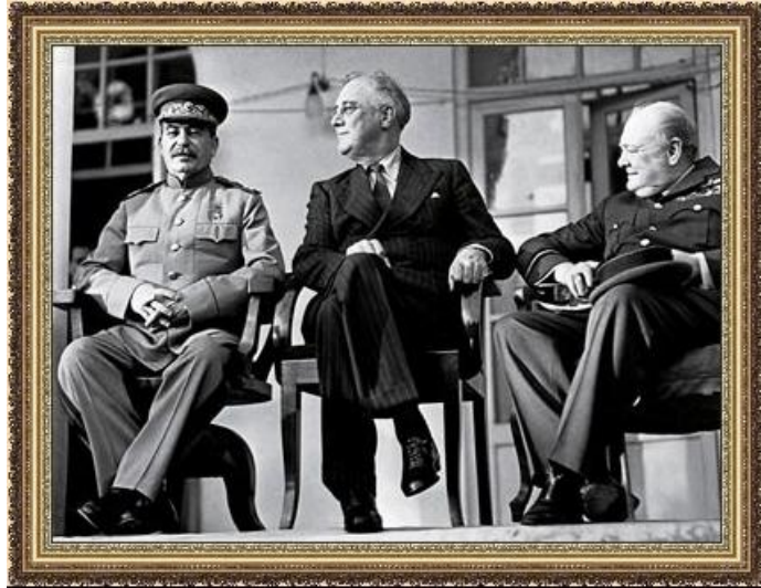
И. Сталин, Ф. Рузвельт, У. Черчилль в Тегеране

Лето - осень 1943 – Освобождены Смоленск, Гомель, Левобережная Украина, Киев.