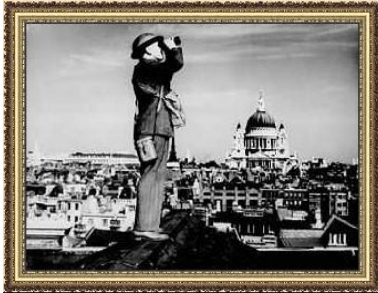
Солдат ПВО на крыше лондонского дома