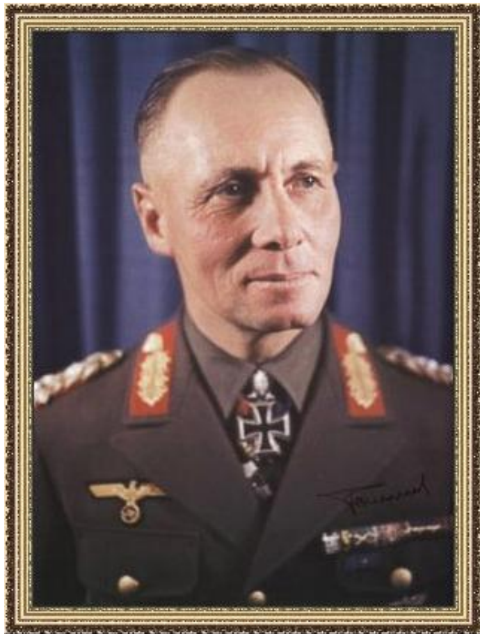
Генерал Э. Роммель

Весна 1941 – Германия в Ливию. Э. Роммель.