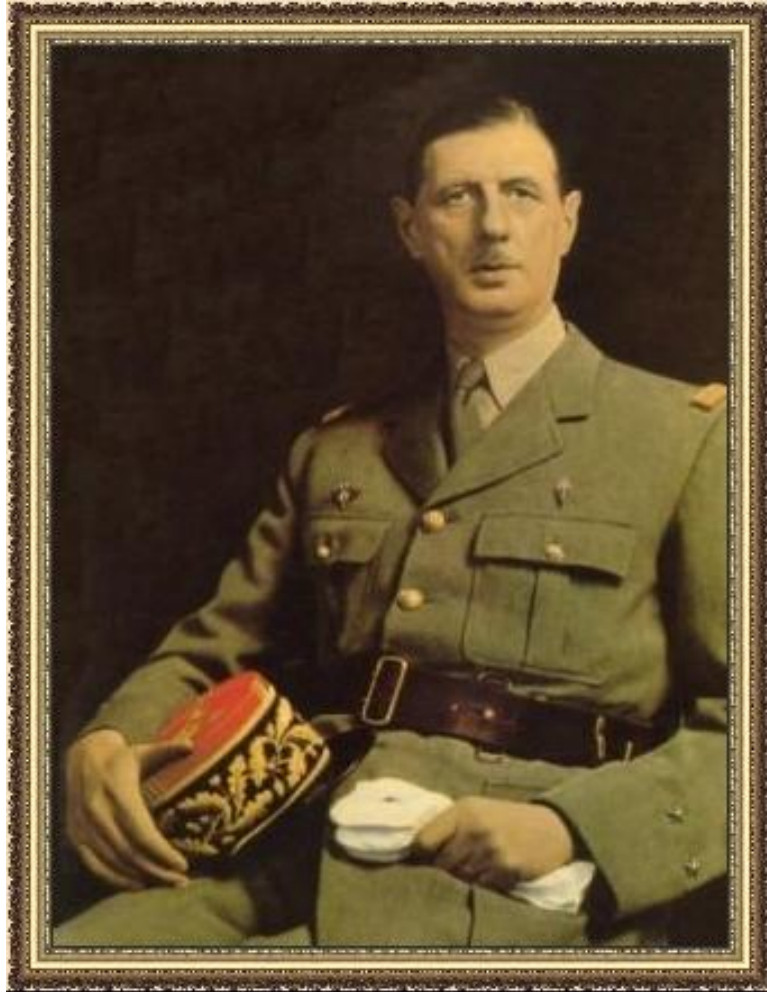
Генерал де Голль

К Тройственному пакту присоединяются Болгария, Венгрия, Румыния, Словакия, Финляндия, Хорватия.