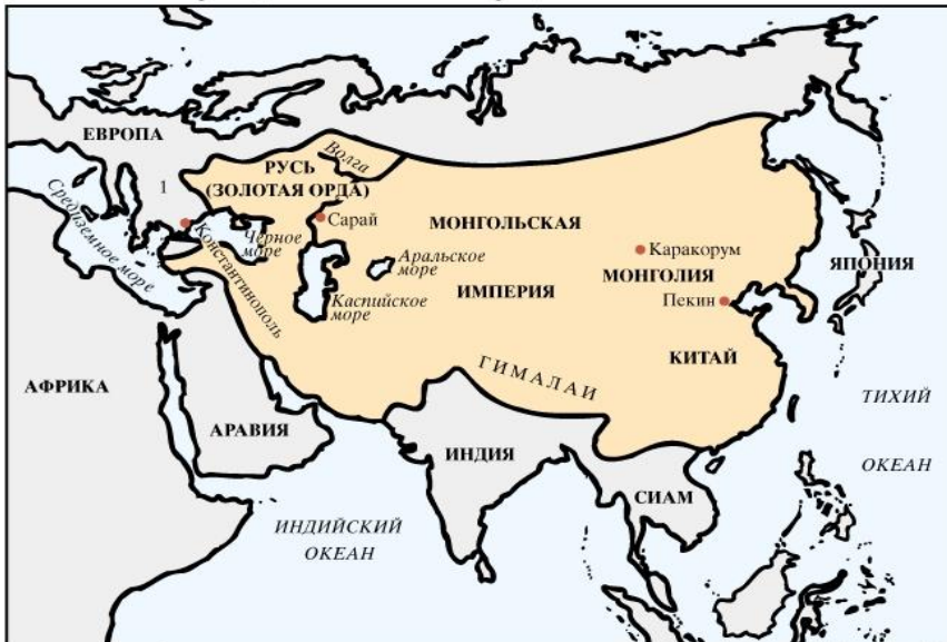
Максимальные границы Монгольской империи, 1227-1405