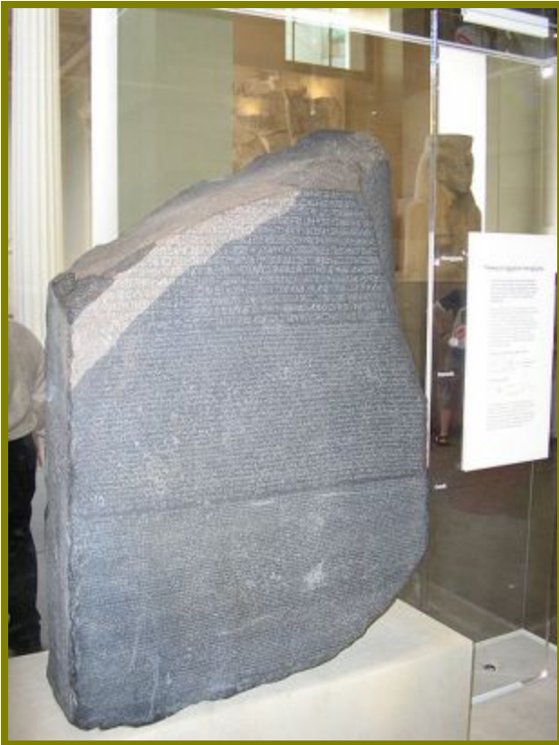
Розеттский камень. С 1802 г. хранится в

15 июля 1799 группе французских солдат под командованием капитана Пьера-Франсуа Бушара при сооружении форта Сен-Жюльен близ города Розетты была обнаружена каменная плита с выбитыми на ней тремя идентичными по смыслу текстами (два текста на древнеегипетском языке и один на древнегреческом языке).