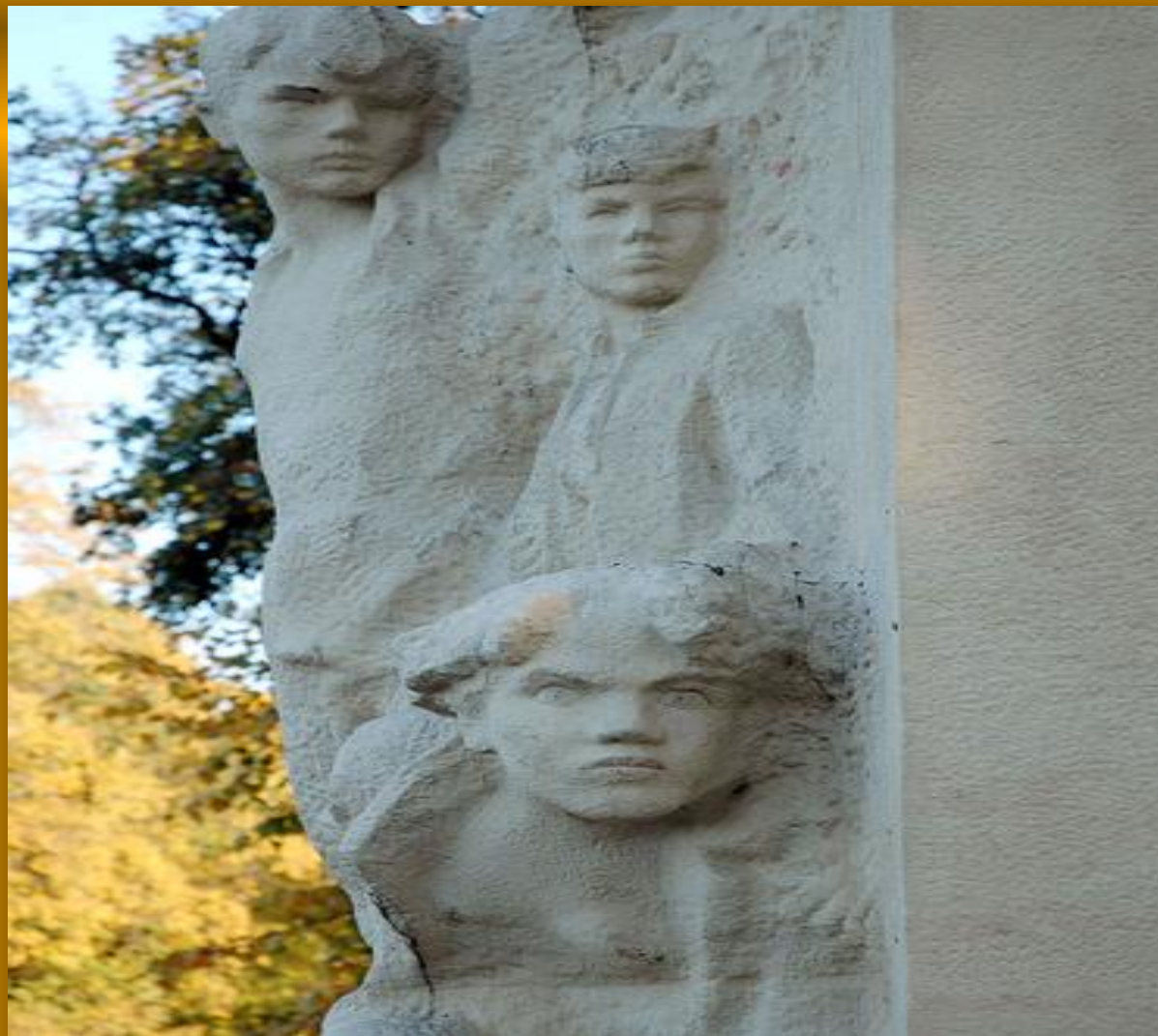
ПАМЯТНИК «ПИОНЕРАМ – ГЕРОЯМ» В ТАВРИЧЕСКОМ САДУ