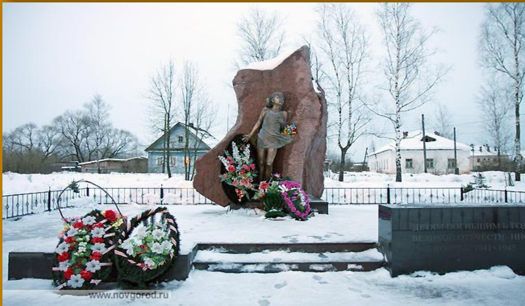
МЕМОРИАЛ «ДЕТЯМ, ПОГИБШИМ В ВЕЛИКОЙ ОТЕЧЕСТВЕННОЙ ВОЙНЕ 1941-1945 ГГ. ПОСЁЛОК ЛЫЧКОВО НОВГОРОДСКОЙ ОБЛАСТИ.