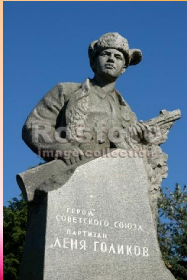
Памятник партизану пионеру-герою Лене Голикову перед зданием администрации Новгородской области. Великий Новгород.