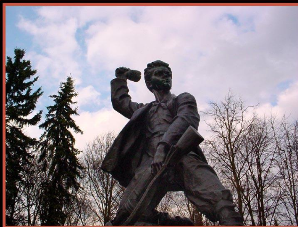
Белоруссия. г Минск, городской парк Памятник Марату Казею