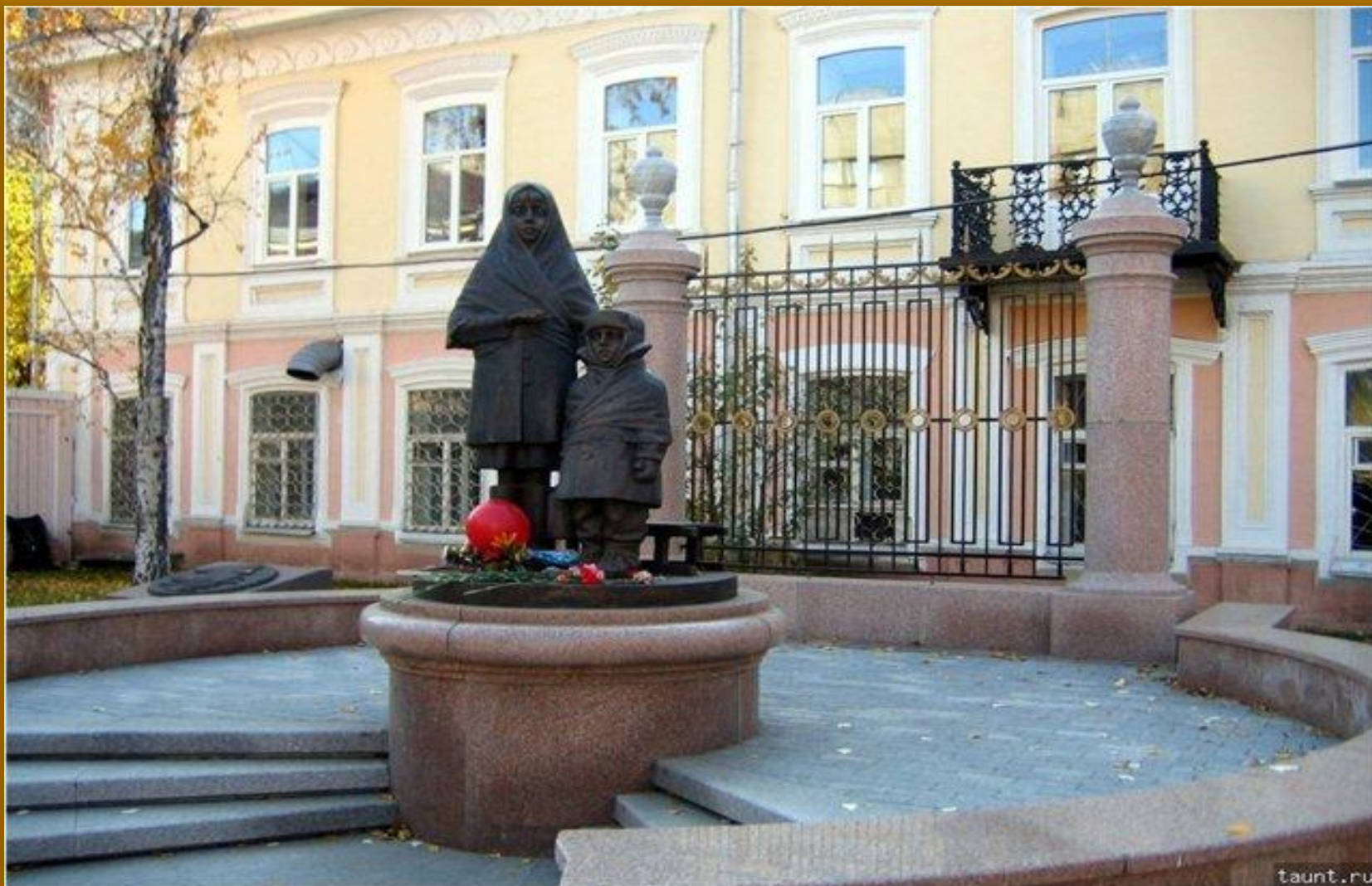
КРАСНОЯРСК. ПАМЯТНИК ДЕТЯМ ВОЙНЫ.