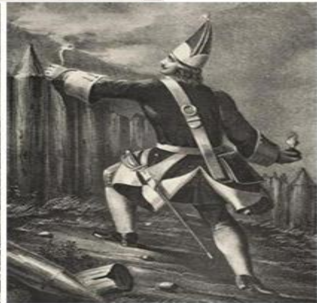
Гренадер пехотного полка