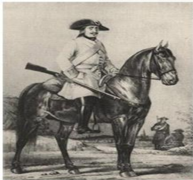
Рядовой драгун 1700 - 1720гг.