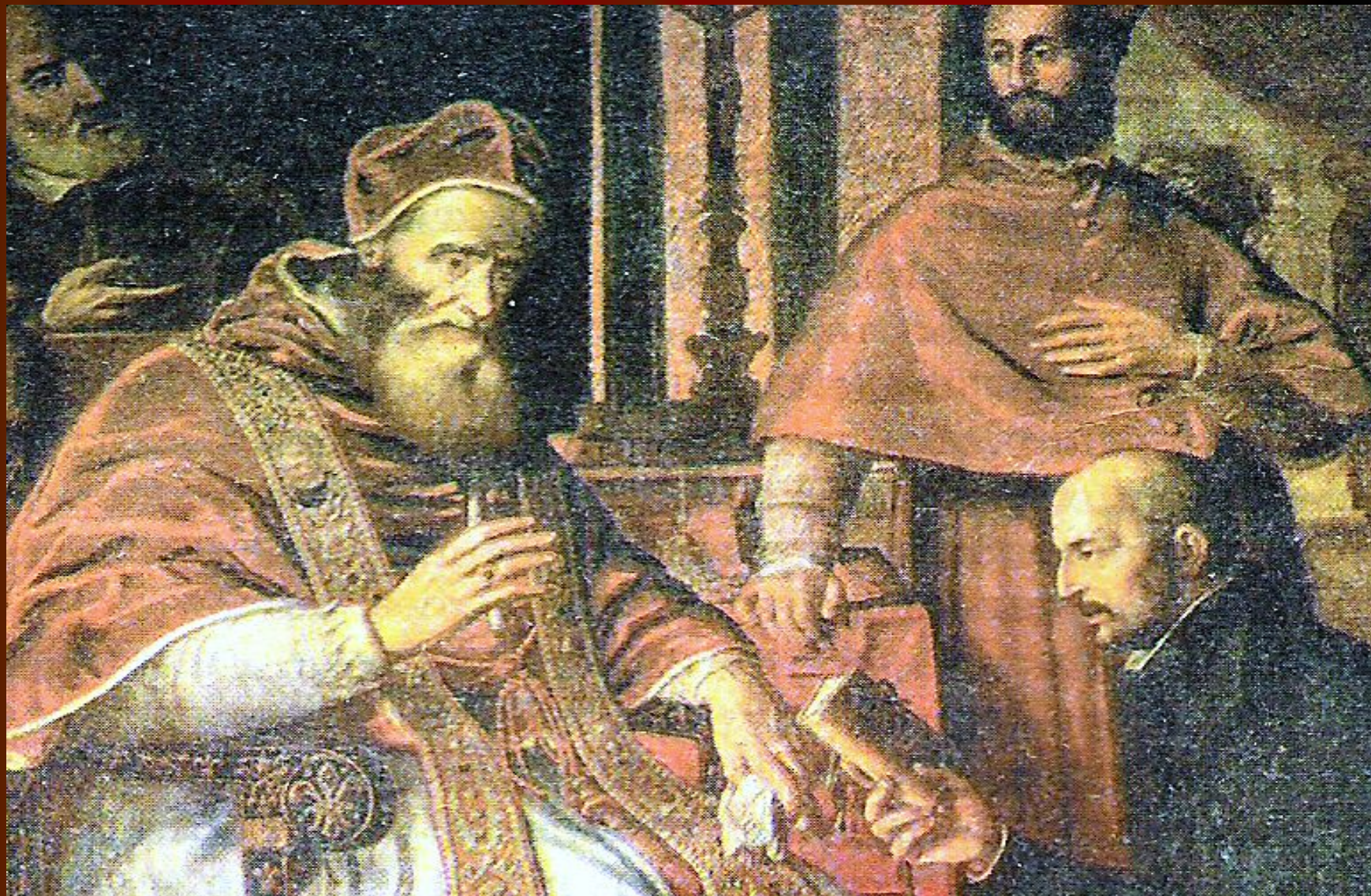
Игнатий Лойола вручает папе Павлу III устав ордена иезуитов.