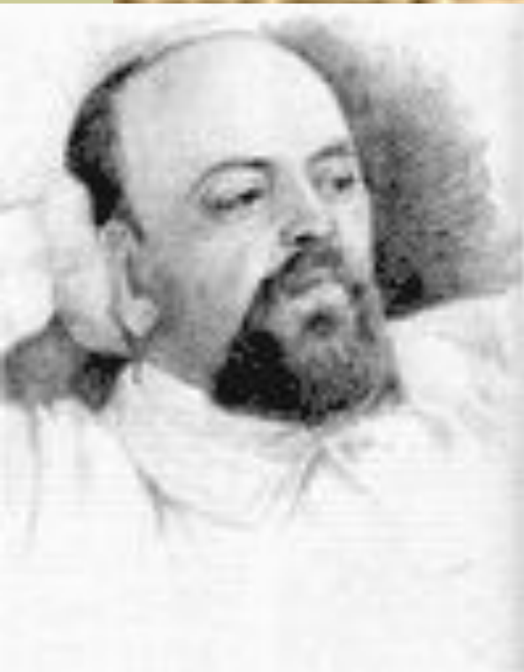
С. И. Мамонтов

1885 г. – частный оперный театр С. И. Мамонтова