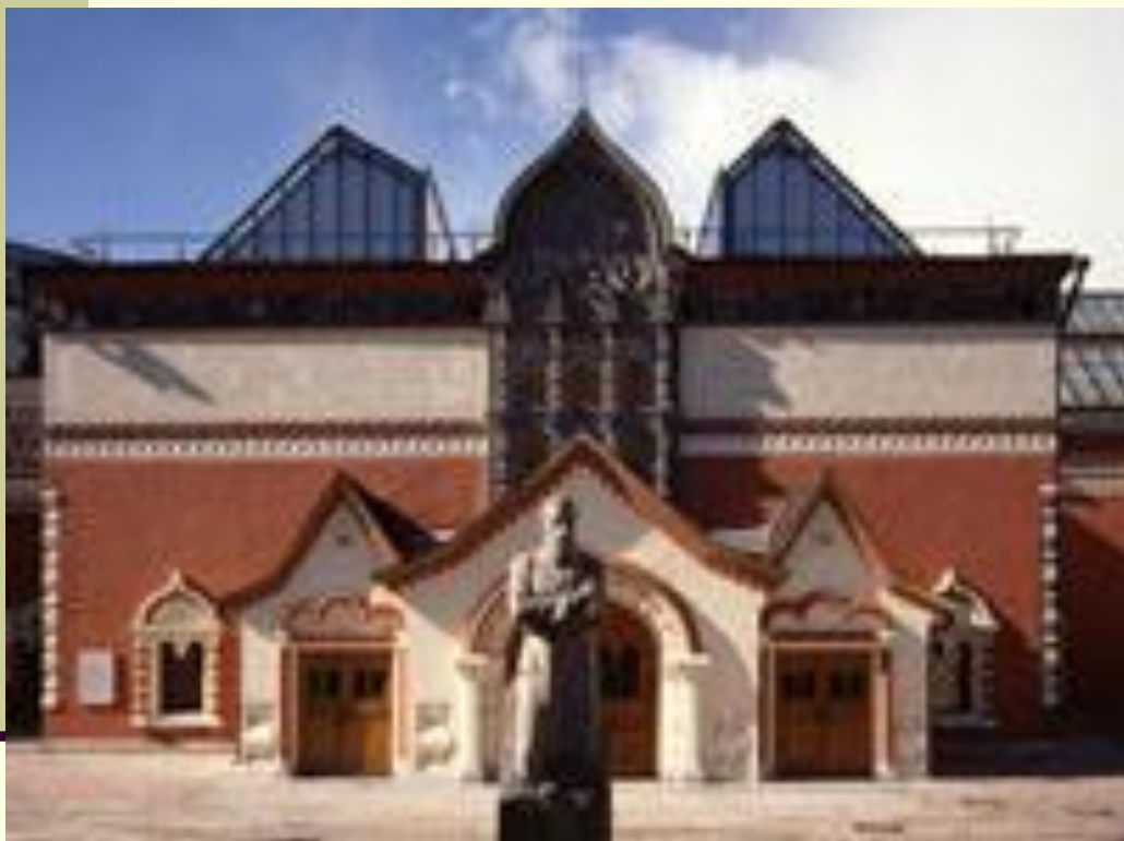
■ Третьяковская галерея