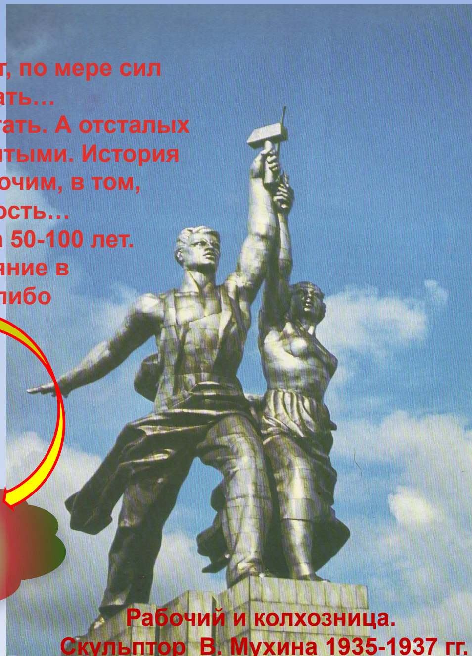
Рабочий и колхозница. Скульптор В. Мухина 1935-1937 гг.