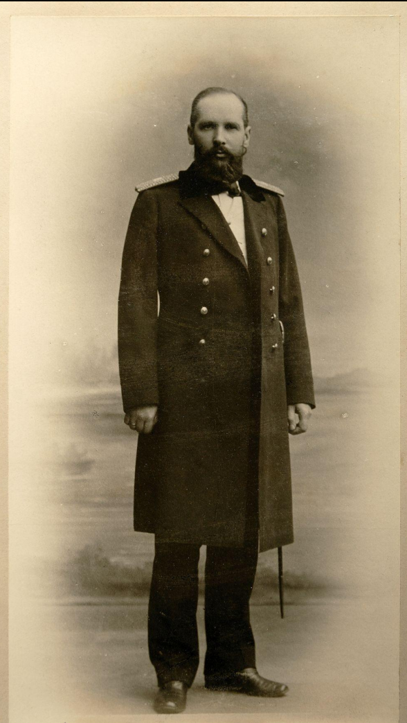
П. А. Столыпин — Гродненский губернатор, в 1902 г.