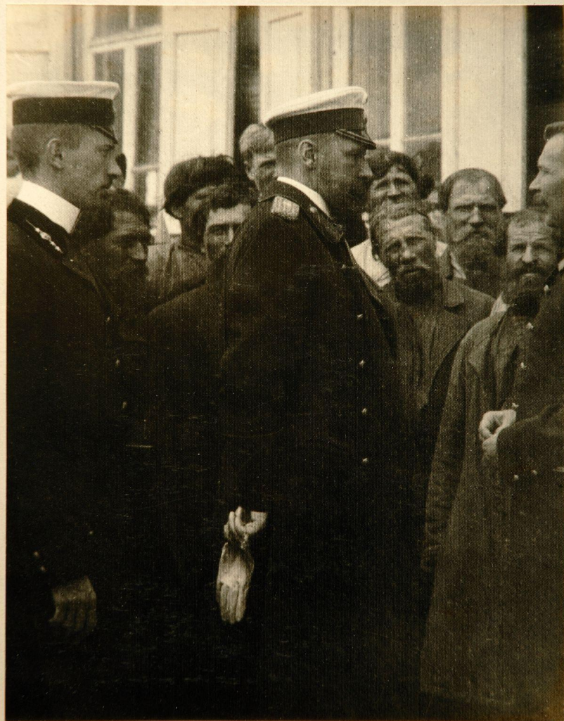
П. А. Столыпинъ — въ селѣ Булгаковѣ Вольскаго уѣзда, въ Юлѣ 1904 г.

« Дайте государству 20 лет покоя внутреннего и внешнего, и вы не узнаете нынешней России»