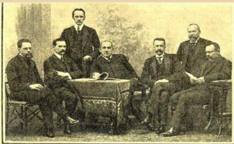
Президиум Гос. Думы 3-го созыва. Стоящие: Г. Г. Замысловский (ст. тов. secr.), бар. А. Ф. Мейендорф (тов. прес.), Н. А. Хохляков (председатель), мн. В. Я. Волковский (тов. прес.), В. П. Соловьев (секретарь). Сидящие: М. А. Искрицкий (тов. секретарь) и Н. В. Антонов (тов. секретарь).

3 июня 1907 г. был создан новый избирательный закон, сохранивший деление на 4 курии. Но изменилось число выборщиков в пользу землевладельцев.