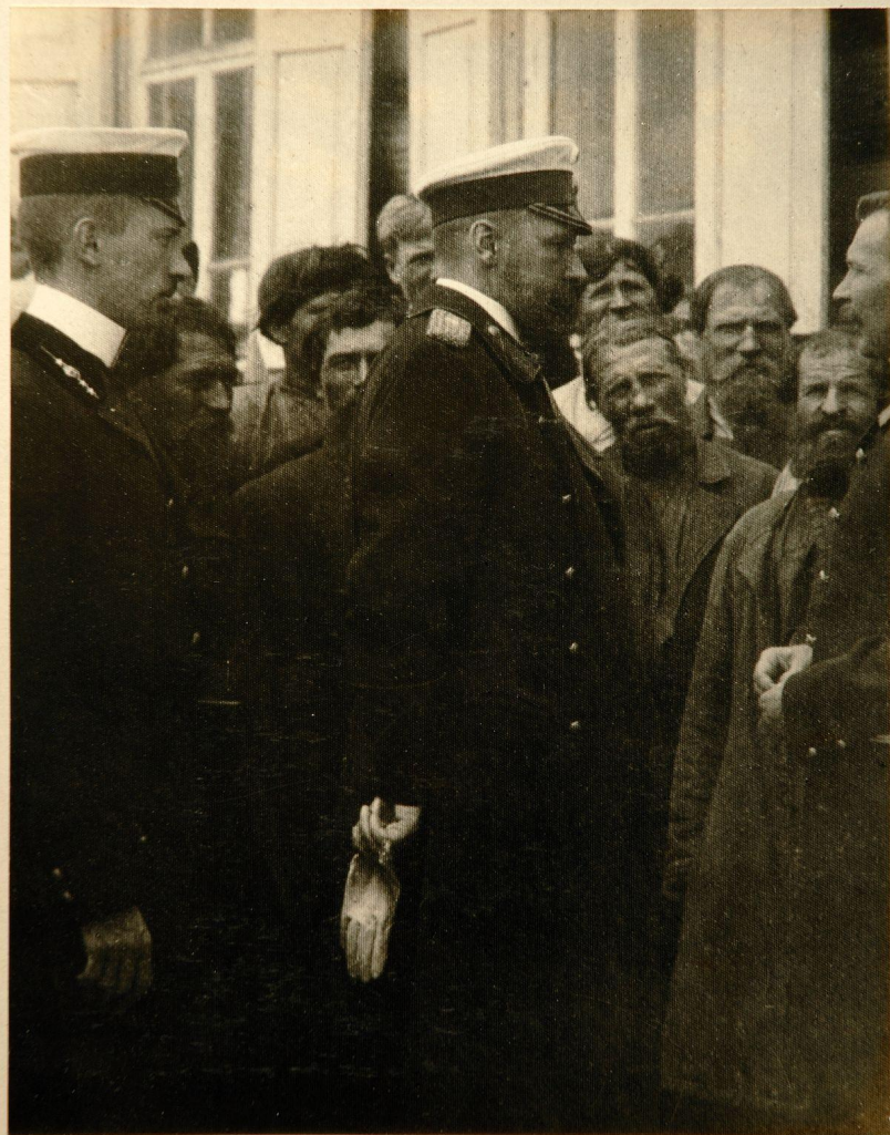
П. А. Столыпинъ — въ селѣ Булгаковѣ Вольскаго уѣзда, въ Юльѣ 1904 г.

« Дайте государству 20 лет покоя внутреннего и внешнего, и вы не узнаете нынешней России»