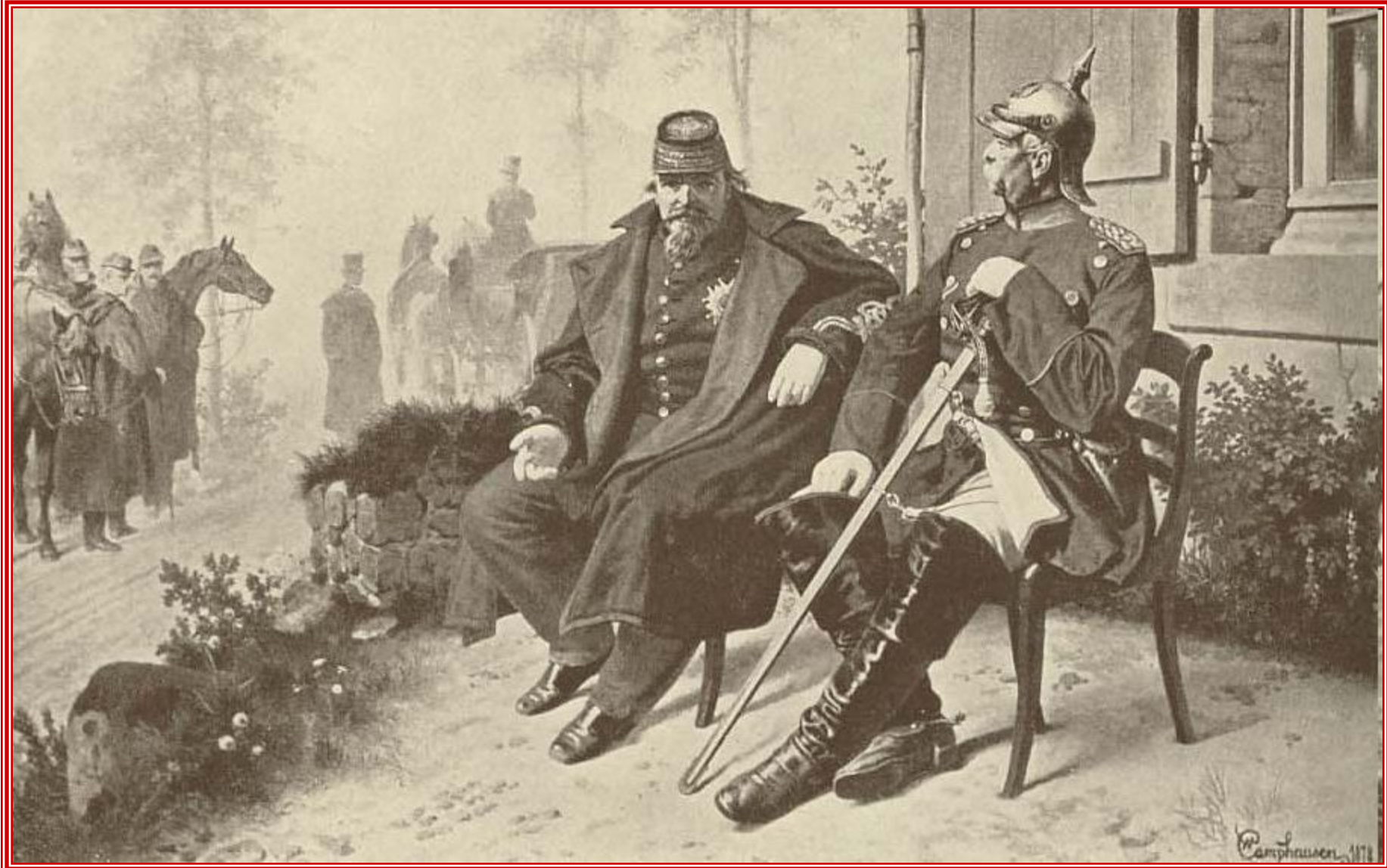
Франко-прусская война, плен и низложение.