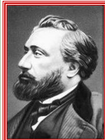
Император Франции Наполеон III