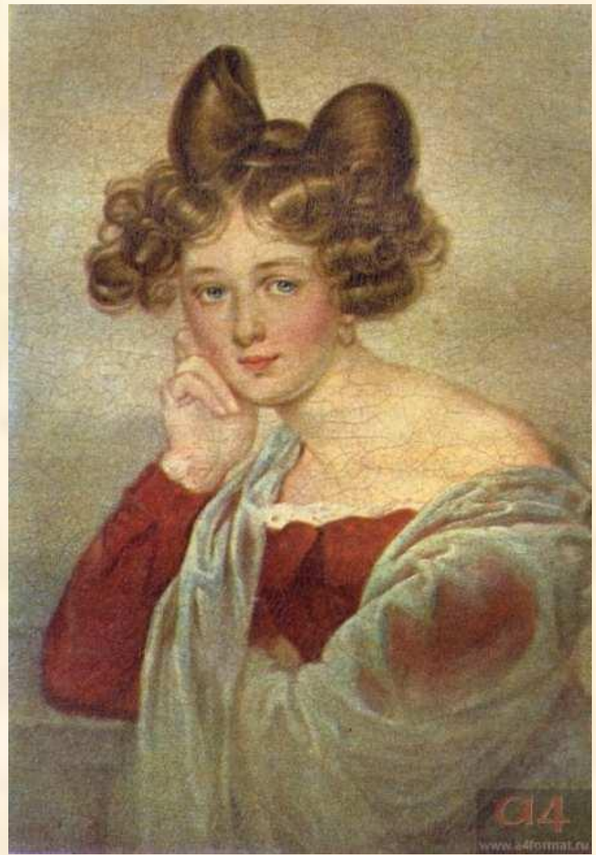
Элеонора Тютчева, первая жена поэта. Художник И. Штилер. 1830-е