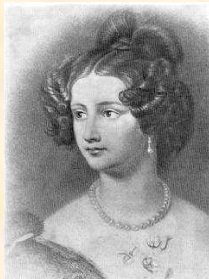
Амалия Крюденер. Фотография с портрета маслом работы художника И.Штилера. 1838 г.

Таков горе - духов блаженный свет; Лишь в небесах сияет он, небесный; В ночи греха, на дне ужасной бездны, Сей чистый огонь, как пламень адский, жжет.