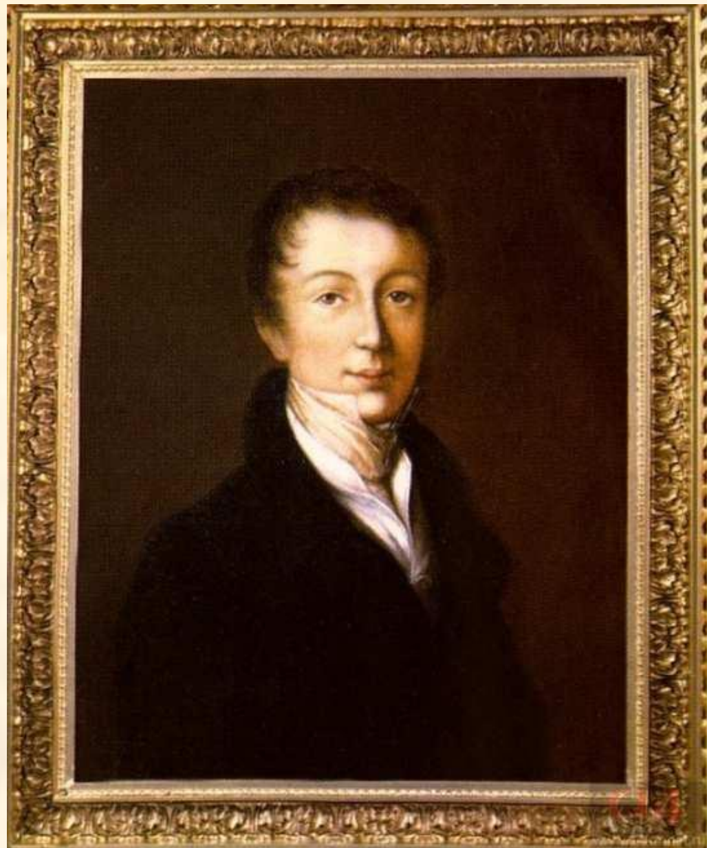
Ф.И. Тютчев. Неизвестный художник. 1819–1820

Я помню время золотое, Я помню сердцу милый край. День вечерел; мы были двое; Внизу, в тени, шумел Дунай. И на холму, там, где, белея, Руина замка вдаль глядит, Стояла ты, молодая фея, На мшистый опершись гранит. Ногой младенческой касаясь Обломков груди вековой; И солнце медлило, прощаясь С холмом, и с замком, и тобой. И ветер тихий мимолетом Твоей одеждою играл И с диких яблонь цвет за цветом На плечи юные свевал. Ты беззаботно вдаль глядела... Край неба дымно гас в лучах; День догорал; звучнее пела Река в померкших берегах. И ты с веселостью беспечной Счастливым провожала день; И сладко жизни быстротечной Над нами пролетала тень.