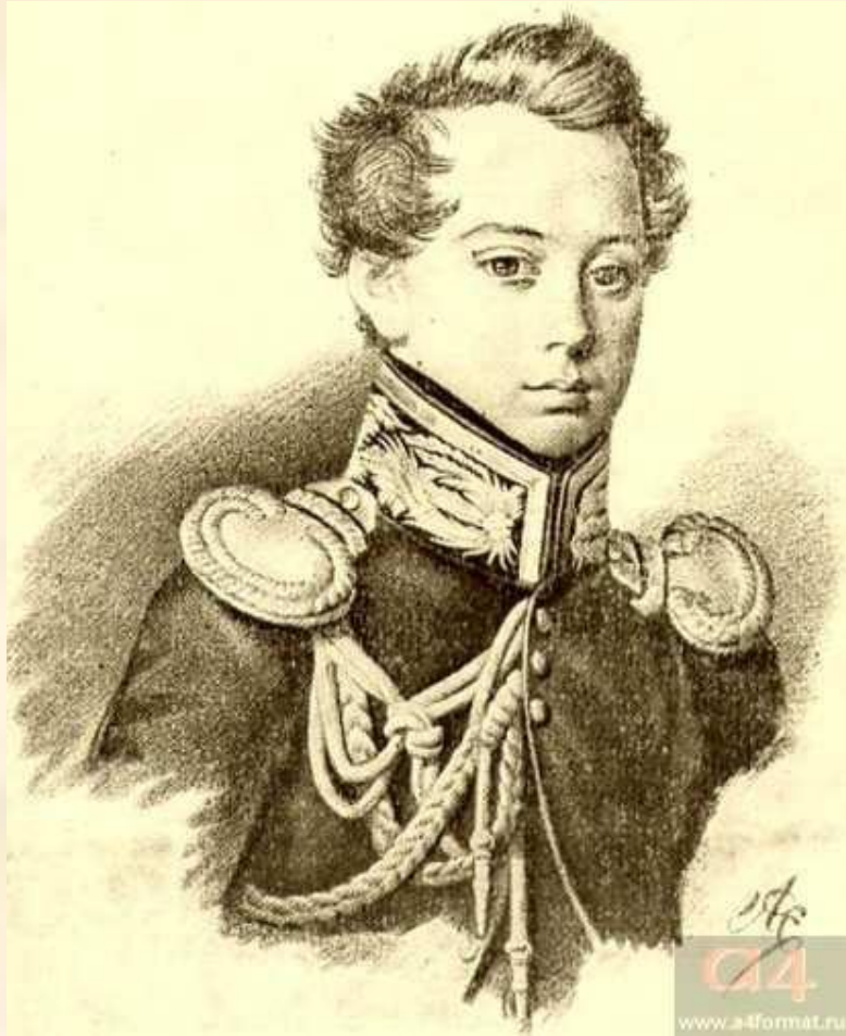
Ф.И. Тютчев. Неизвестный художник. 1825