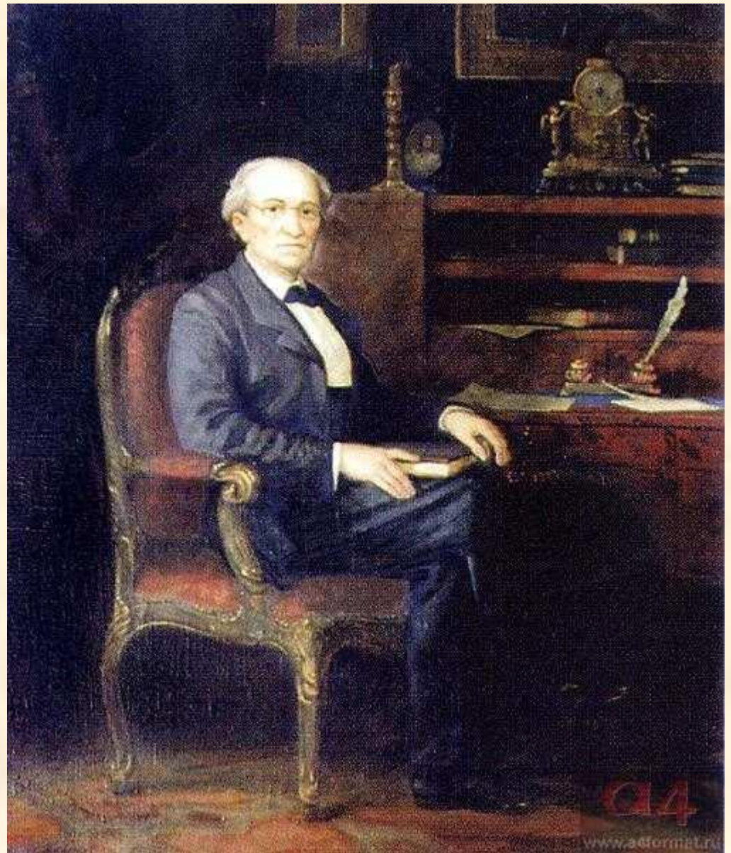
Ф.И. Тютчев. Художник М. Решетнев