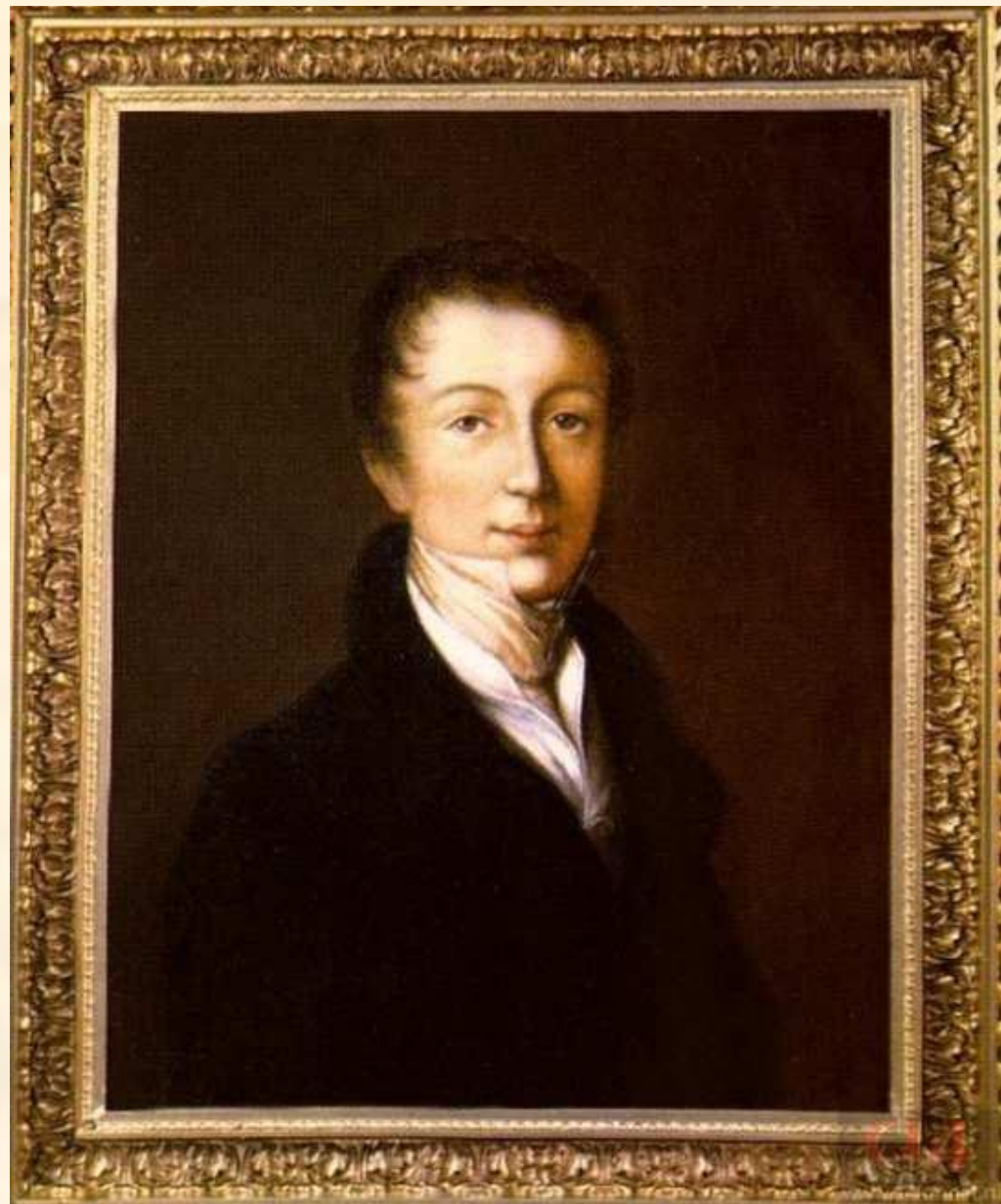
Ф.И. Тютчев. Неизвестный художник. 1819–1820

Я помню время золотое, Я помню сердцу милый край. День вечерел; мы были двое; Внизу, в тени, шумел Дунай. И на холму, там, где, белея, Руина замка вдаль глядит, Стояла ты, молодая фея, На мшистый опершись гранит. Ногой младенческой касаясь Обломков груди вековой; И солнце медлило, прощаясь С холмом, и с замком, и тобой. И ветер тихий мимолетом Твоей одеждою играл И с диких яблонь цвет за цветом На плечи юные свевал. Ты беззаботно вдаль глядела... Край неба дымно гас в лучах; День догорал; звучнее пела Река в померкших берегах. И ты с веселостью беспечной Счастливым провожала день; И сладко жизни быстротечной Над нами пролетала тень.