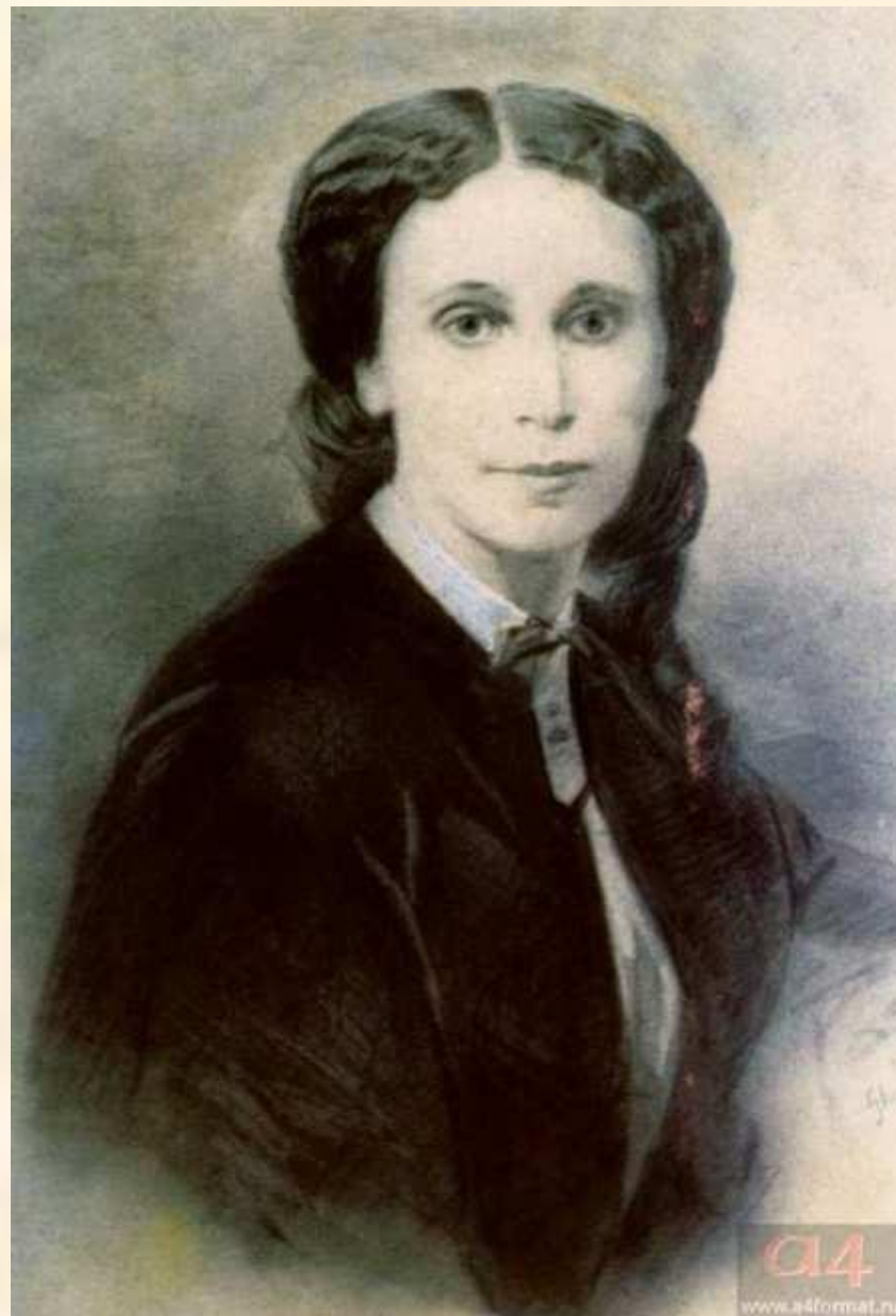
Е.А. Денисьева. Фото начала 1860-х

«Денисьевский» цикл - это собрание стихотворений Ф.И. Тютчева, в которых говорится о его любви к Елене Денисьевой. Отношения поэта с Денисьевой были более чем драматичными, однако продолжались в течение четырнадцати лет. Общество с трудом мирилось с их связью: во-первых, Тютчев был женат, во-вторых, возлюбленная годилась ему в дочери. Но, несмотря ни на что, отношения продолжались.