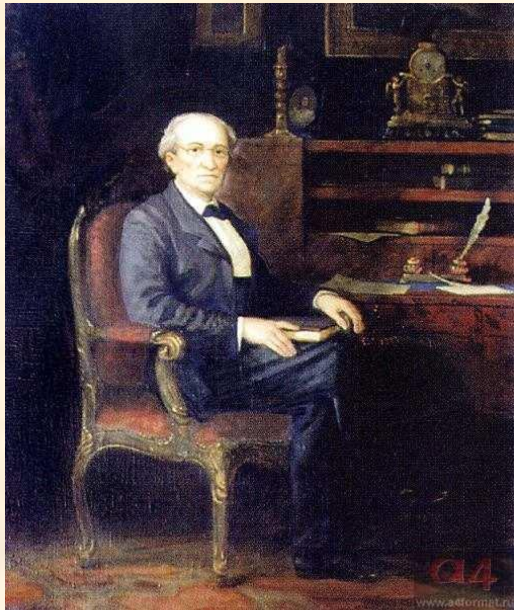
Ф.И. Тютчев. Художник М. Решетнев