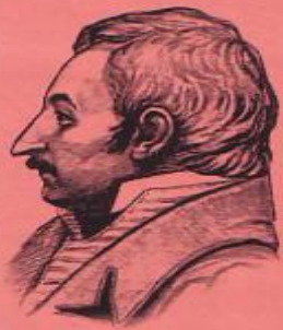
Н.В. Гоголь. Детство и юность