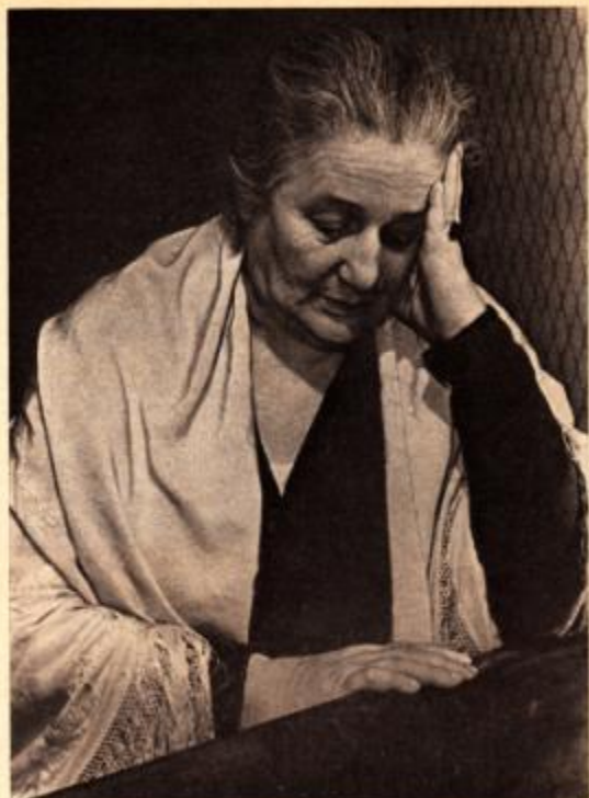
А. А. Ахматова. 1960

В этой жизни я немного видела, Только пела и ждала.