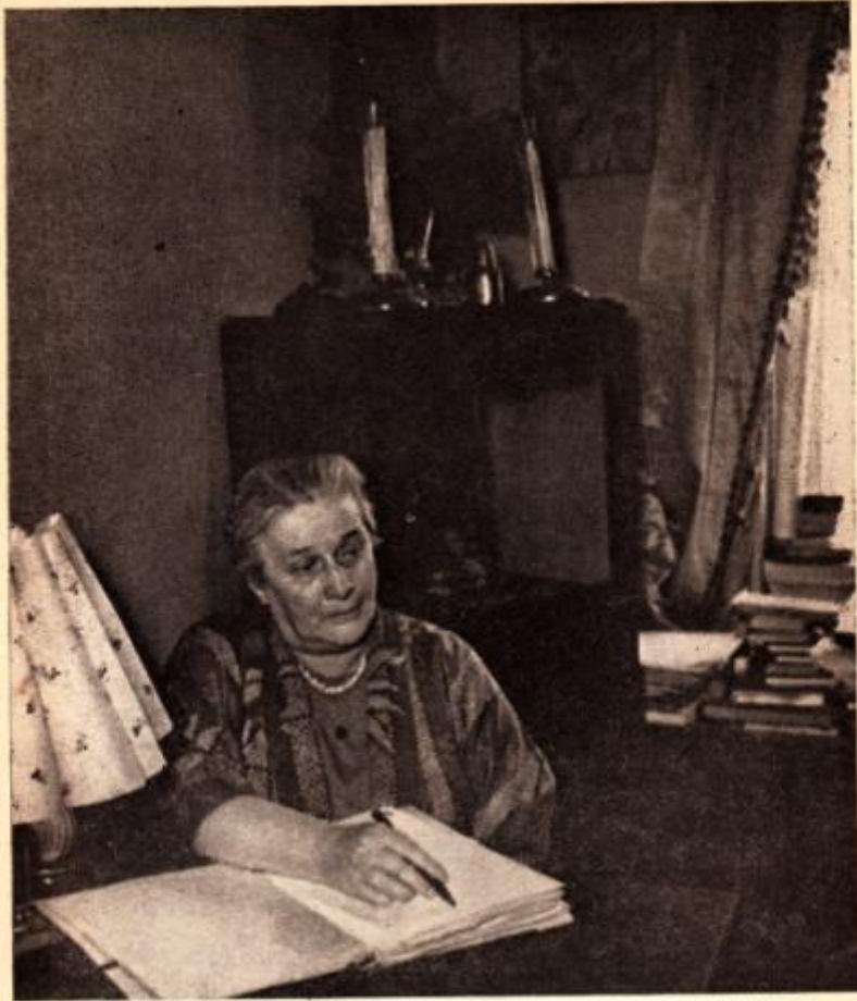
А. А. Ахматова. 1956