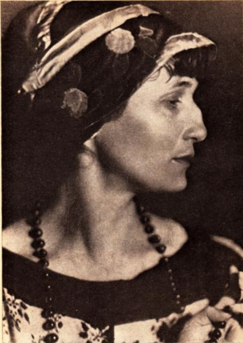
А. А. Ахматова. 1925