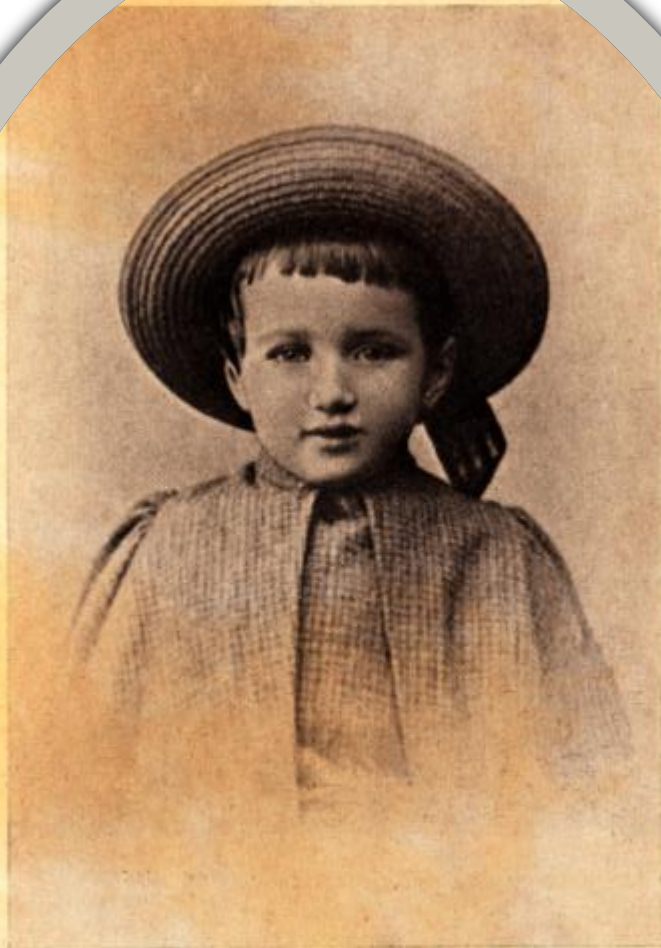
А. А. Ахматова в детстве. 1894

1889г. 23 июня в селении Большой Фонтан близ Одессы родилась Анна Горенко.