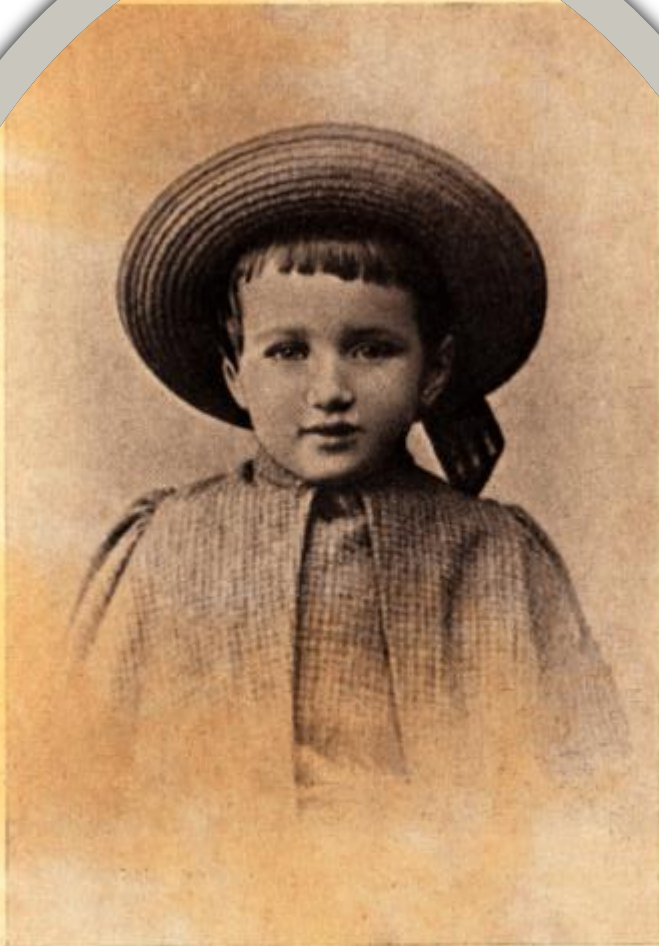
А. А. Ахматова в детстве. 1894

Училась в женской Царскосельской гимназии.