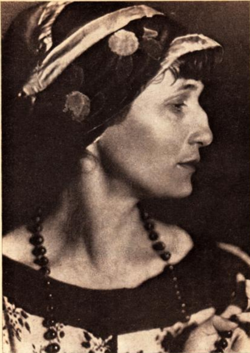
А. А. Ахматова. 1925