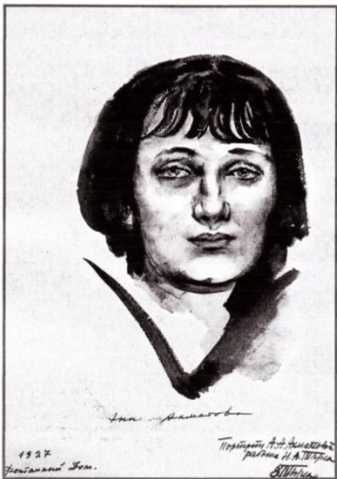
К статье Л.С.Клиба, Н.А.Тырса, Портрет А.А.Ахматовой. 1928