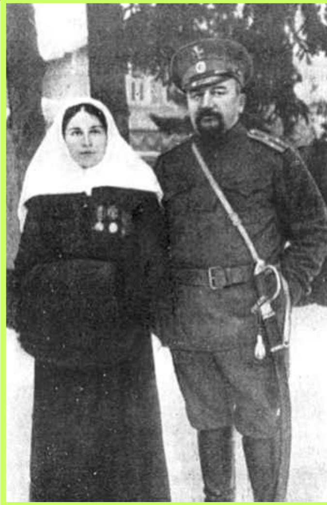
А.И.КУПРИН И Е.М.КУПРИНА