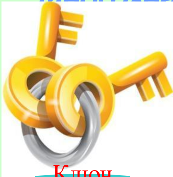
Ключ (от замка)