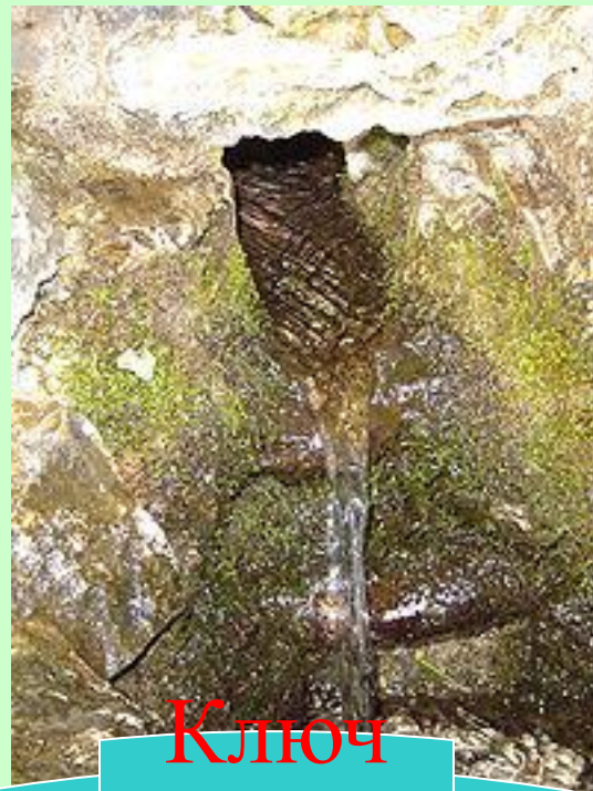
Ключ (родни к)