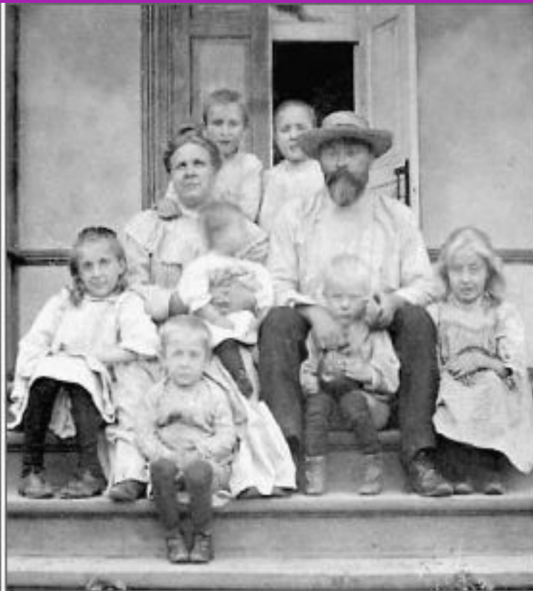
Семья Булгаковых на даче (1903)

В загородном доме– даче, в поселке Буча под Киевом, семья регулярно проводила летние месяцы