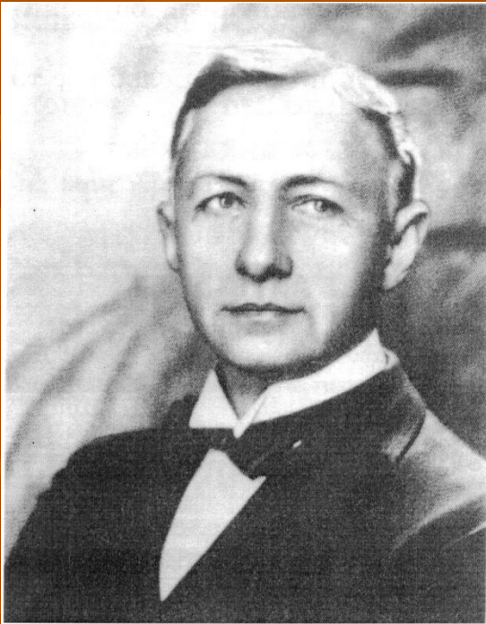
ИВАН АЛЕКСЕЕВИЧ БУНИН 1870 - 1953