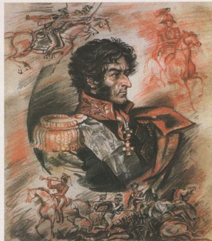
Петр Иванович Багратион 1765—1812

«Багратион — лучший генерал русской армии», — говорил Наполеон. Участник штурма Очакова, Варшавы, Багратион проделал с Суворовым весь Итальянский поход, был его правой рукой. Взятие Брешины, Бергамо, Лекко, Тортоны, Турина и Милана, битва при Треббии, при Нови — везде Багратион находился в самых трудных и решающих местах. Знаменитый Швейцарский поход Суворова принес славу и Багратиону, проявившему героизм, хладнокровие, волю к победе.