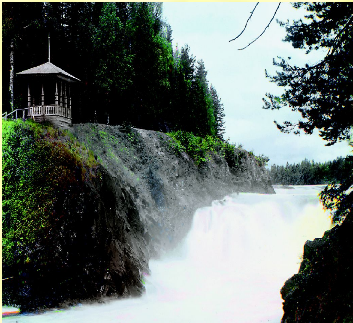
Водопад Кивач. Первое цветное фото водопада. 1915 г.