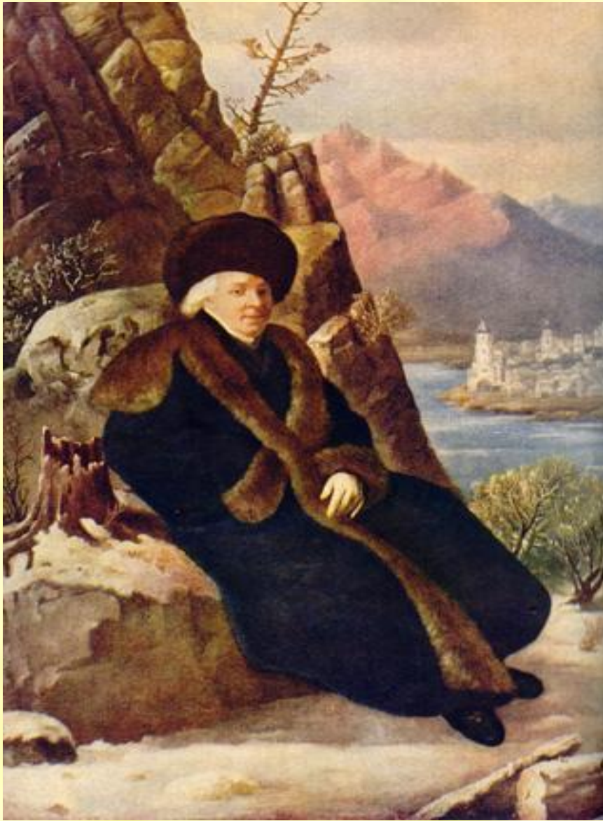
Портрет поэта Г.Р. Державина.