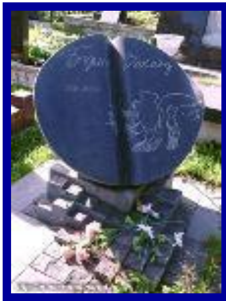
Могилу Бориса Владимировича Заходера