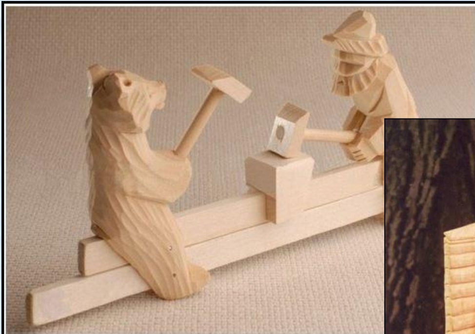
Богородская игрушка "Кузнецы".

Легенда о том, как зародился промысел Богородской игрушки, рассказывает, что первую деревянную игрушку сделал сам Преподобный Сергей. Будто бы он в свободное от молитв и трудов время вырезал из липы птичек, коньков и дарил "на благословенье" детям.