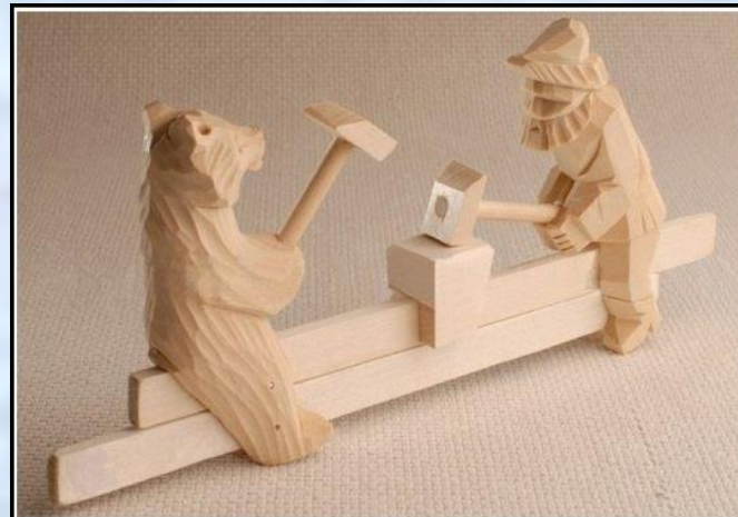
Богородская игрушка "Кузнецы".

Легенда о Богородских Легенда о Богородских игрушках