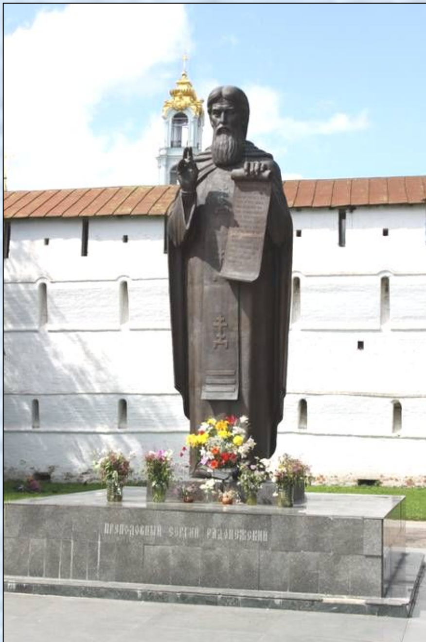
Памятник Сергию Радонежскому в Сергиевом Посаде