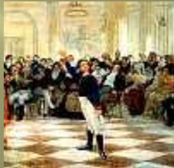
А. С. Пушкин - лицеист