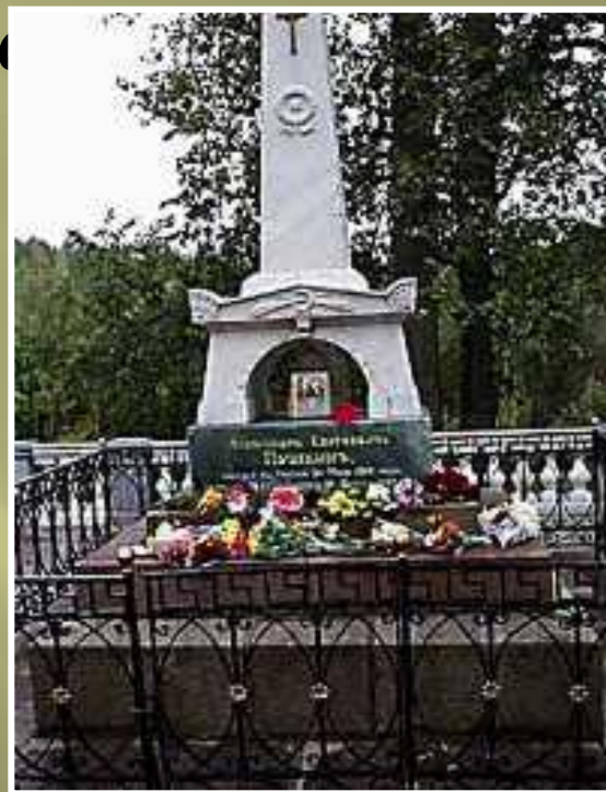
Могила А. С. Пушкина в наше время.