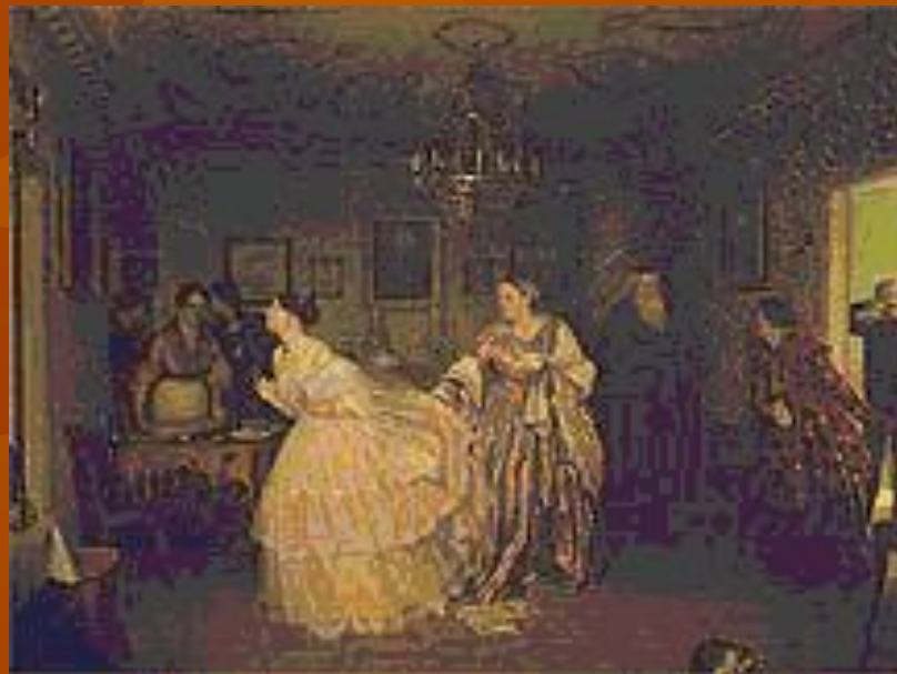
П. А. Федотов. «Сватовство майора». 1848 год. Третьяковская галерея.