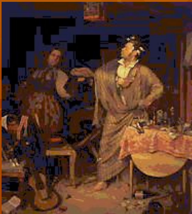
П. А. Федотов. «Свежий кавалер». 1846. Третьяковская галерея.