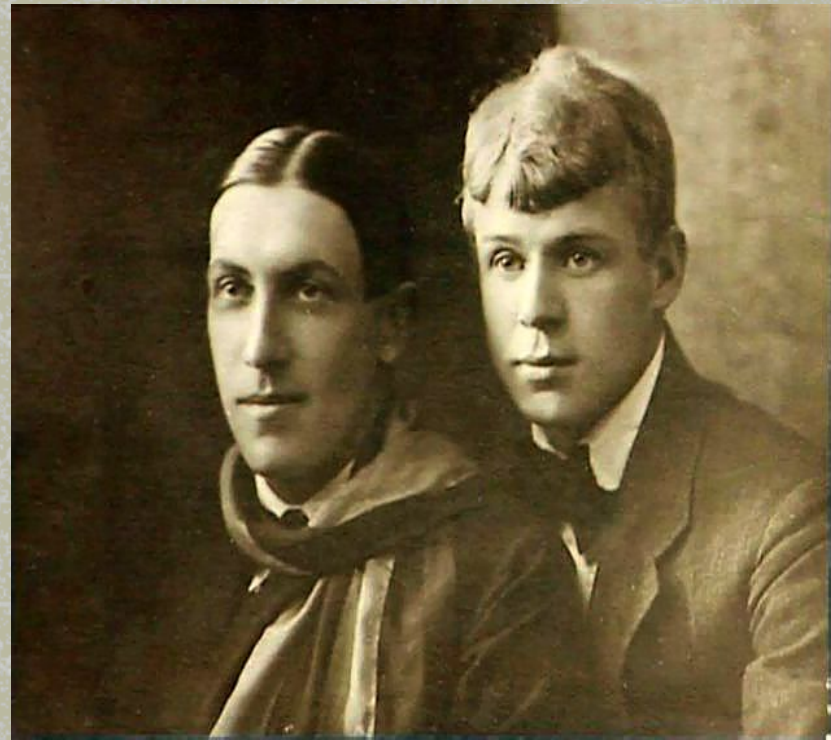
А. Мариенгоф и С. Есенин