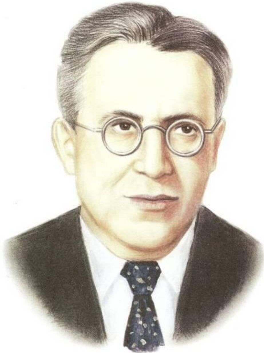
Маршак Самуил Яковлевич (1887-1964)