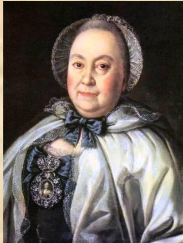
А.П.Антропов. Портрет статс- дамы М.А. Румянцевой. 1764