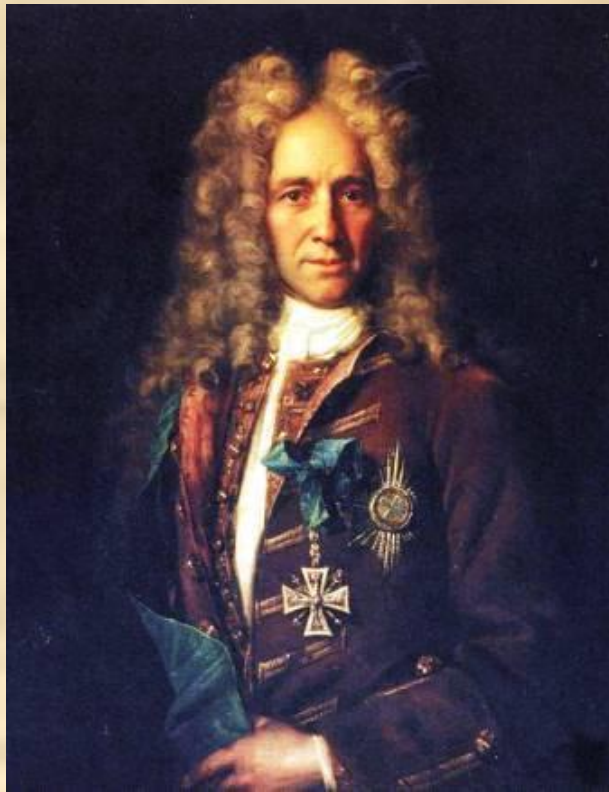
И.Н.Никитин. Портрет канцлера графа Г.И. Головкина. 1720-е