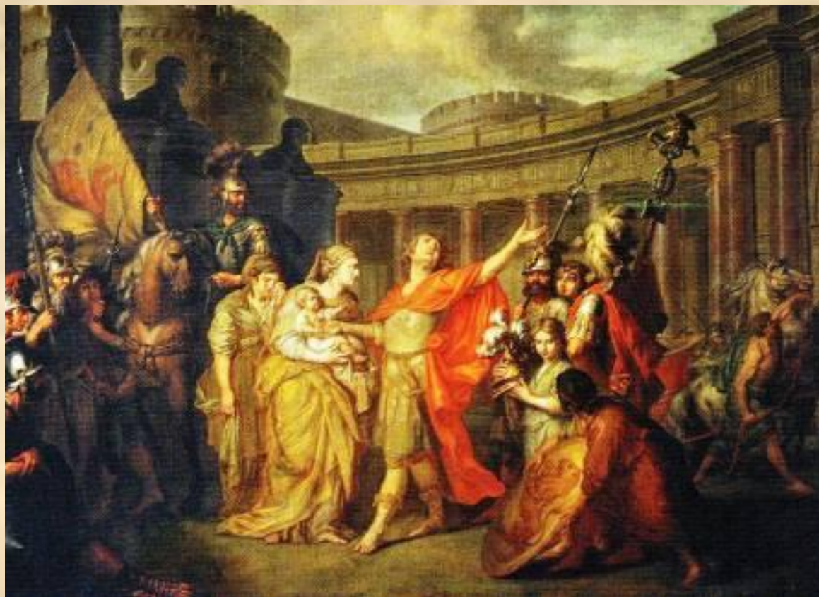
А.П.Лосенко. Прощание Гектора с Андромахой. 1773