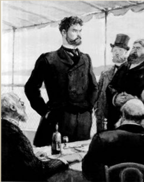
Иллюстрация к роману М. Горького "Фома Гордеев"

Горький считал, что революционная деятельность во имя переустройства мира преобразует и обогащает внутренний мир человека.