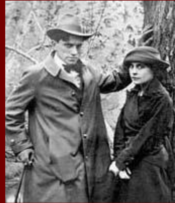
В. В. Маяковский и Л. Ю. Брик

Поэма "Во весь голос" (1930) воспринимается как поэтическое завещание Маяковского, полное глубокой внутренней веры в торжество коммунизма.