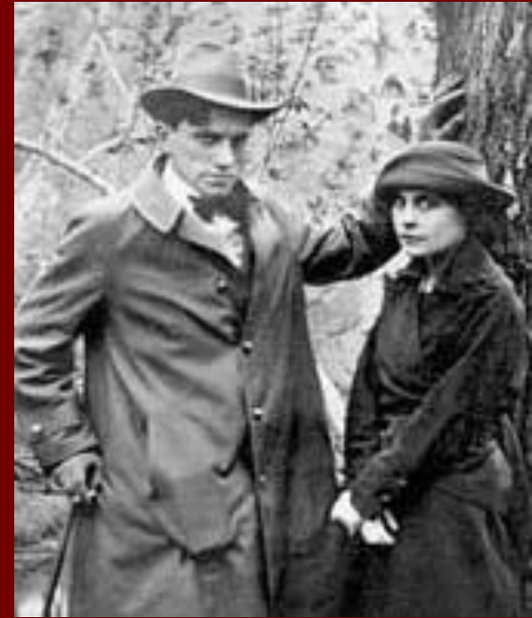
В. В. Маяковский и Л. Ю. Брик

Поэма "Во весь голос" (1930) воспринимается как поэтическое завещание Маяковского, полное глубокой внутренней веры в торжество коммунизма.