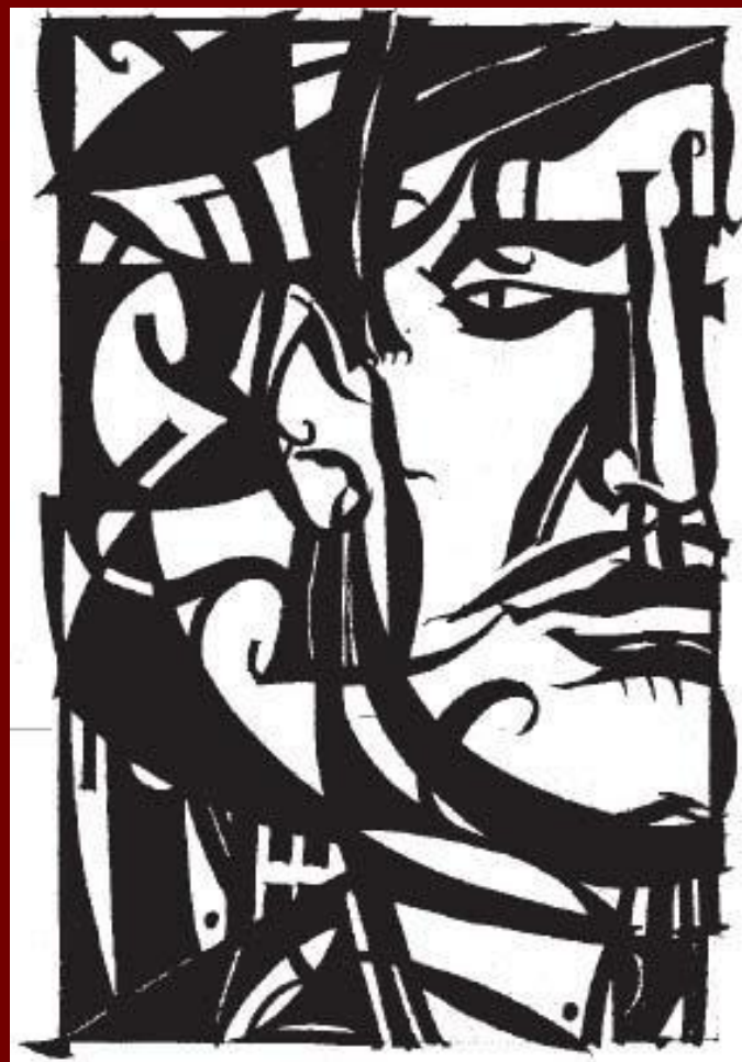
Обложка «Облако в штанах»

Новым этапом явилась поэма "Облако в штанах". Поэма отразила растущую силу миллионов, стихийно поднимающихся против капитализма и осознающих свой путь в борьбе. Основным пафосом дооктябрьских поэм Маяковского - "Флейта-позвоночник" (1916 г.), "Война и мир" (отдельное издание - 1917 г.), "Человек" (1916-17 гг., опубликована в 1918 г.) - был протест против буржуазных отношений, калечивших подлинную натуру Человека.