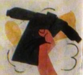
4) Значит - помогать ей нужно - дело ясное.