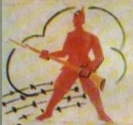
3) Значит нужна еще армия красная,