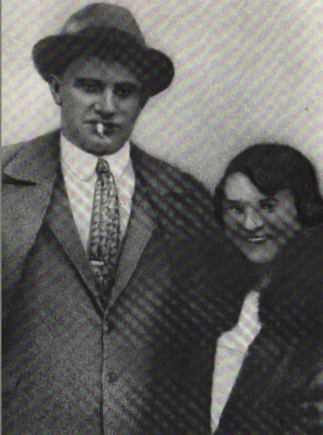
Маяковский и Мария Мейерова