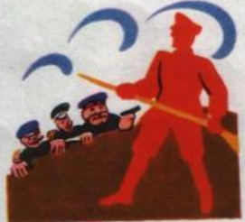
3. ТОЛЬКО ШТЫК КРАСНОАРМЕЙЦА ОХРАНИЛ ЭТО ЗНАМЯ