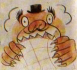
2) Еще живет чудовище мирового капитала,