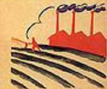
4. ЗАЙМУТСЯ ДЛЯ РАСЦВЕТА РОССИИ ТРУДОМ.