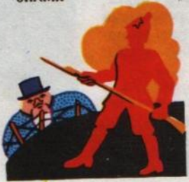
5. ТОЛЬКО С ПОМОЩЬЮ КРАСНОАРМЕЙЦЕВ ЗНАМЯ ЭТО