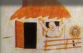
3. ВЕРНУТСЯ СОЛДАТЫ К СЕБЕ В ДОМ,