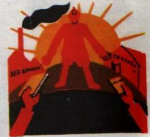
8. ОКТЯБРУ В ЧЕСТЬ РАБОТУ ПО УКРЕПЛЕНИЮ АРМИИ ВЕСТЬ