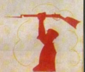
6. ГОТОВ БУДЬ!