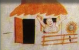
3. ВЕРНУТСЯ СОЛДАТЫ К СЕБЕ В ДОМ,