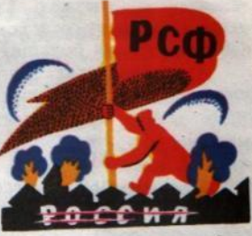
2. ФЛАГ ОКТЯБРЬСКИЙ ВОДРУЗИТЬ АЛ