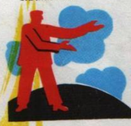
7. ТАК СТАРАЙСЯ-Ж КАЖДЫЙ