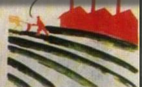
4. ЗАЙМУТСЯ ДЛЯ РАСЦВЕТА РОССИИ ТРУДОМ.