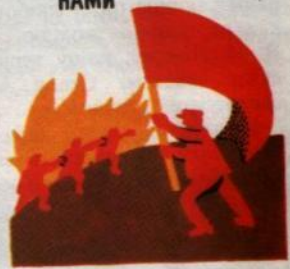
6. ДОНЕСЕМ ДО ОСВОБОЖДЕНИЯ ВСЕГО СВЕТА