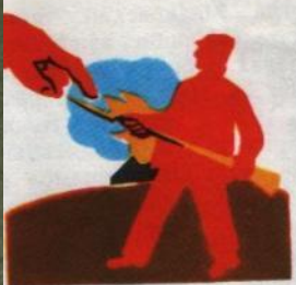
1. ШТЫК КРАСНОГВАРДЕЙЦА ВОЗМОЖНОСТЬ ДАЛ