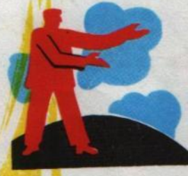
7. ТАК СТАРАЙСЯ-Ж КАЖДЫЙ