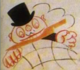
ОДНО НЕ ЗАБУДЬ - ЖИВ НАПАТИЛИЗМ В 3/4 СВЕТА.