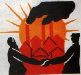
4. ОКТЯБРЬСКУЮ РЕВОЛЮЦИЮ ЗАКРЕПИЛ ЗА НАМИ