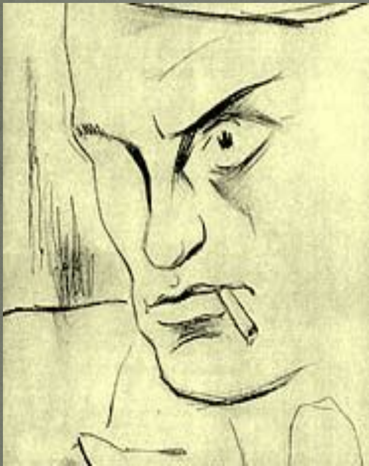
Ю. П. Анненков. «Владимир Маяковский».

«Маяковский принадлежал к группе футуристов... Наиболее глубоким был Хлебников, наиболее последовательным, ортодоксальным — Крученых, наиболее патетичным — Пастернак, наиболее сильным и человечным — Маяковский . Он был огромного роста, мускулист и широкоплеч. Волосы он то состригал наголо, то отращивал до такой степени, что они не слушались уже ни гребенки, ни щетки и упрямо тарацились в беспорядке — сегодня в одном направлении, завтра — у другом. Тонкие брови лежали над самыми глазами, придавая им злобный оттенок. Нижняя челюсть плотоядно выдавалась вперед. Гордый своей внешностью, он писал: Иду — красивый, Двадцатидвухлетний... («Облако в штанах», 1915)» (Ю. П. Анненков. «Дневник моих встреч»).