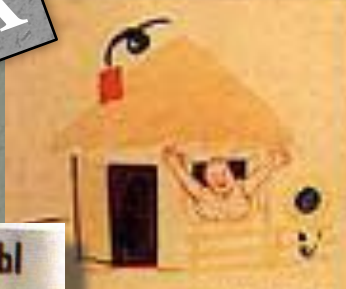
3. ВЕРНУТСЯ СОЛДАТЫ К СЕБЕ В ДОМ,