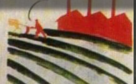
4. ЗАЙМУТСЯ ДЛЯ РАСЦВЕТА РОССИИ ТРУДОМ.