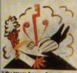
1) Мы добились русских Белогвардейцев. Этого мало: