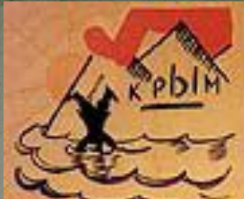
1. ВРАГ ПОСЛЕДНИЙ ГОТОВ!