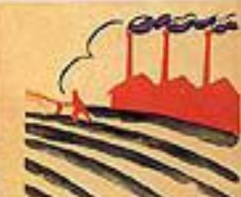
4. ЗАЙМУТСЯ ДЛЯ РАСЦВЕТА РОССИИ ТРУДОМ.