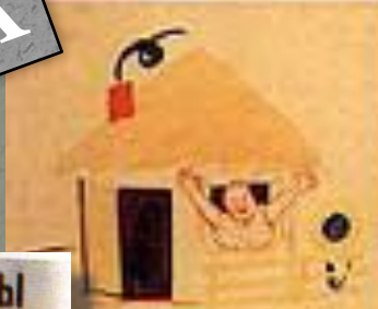
3. ВЕРНУТСЯ СОЛДАТЫ К СЕБЕ В ДОМ,