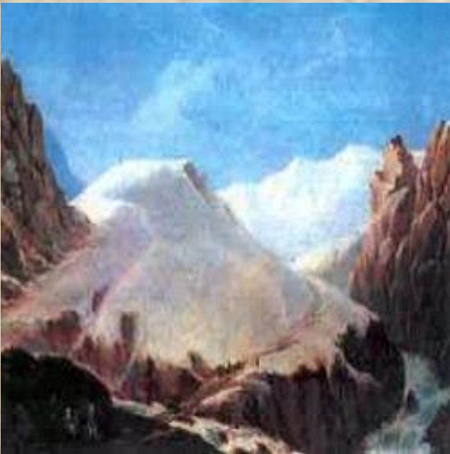
М. Ю. Лермонтов «Крестовая гора».

На Кавказе были написаны многочисленные произведения, в которых поэт признаётся в своей любви Кавказу.