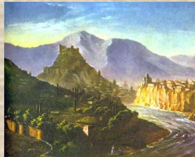
М. Ю. Лермонтов «Вид Тифлиса».