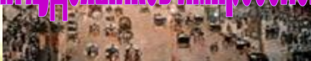
Камиль Писсаро Площадь Театра Франсез