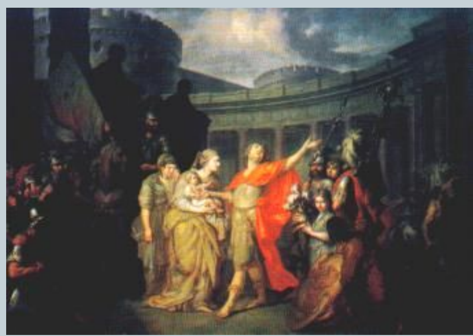
Прощание Гектора с Андромахой

Могучий Гектор, защитник Трои, вернулся ненадолго в свой город, « чтобы увидеть домашних, жену дорогую и сына».