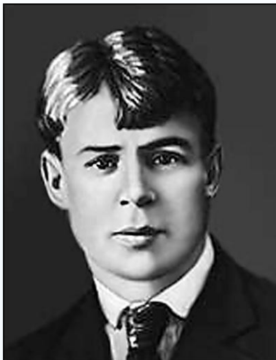
*Сергей Александрович Есенин 1895-1925