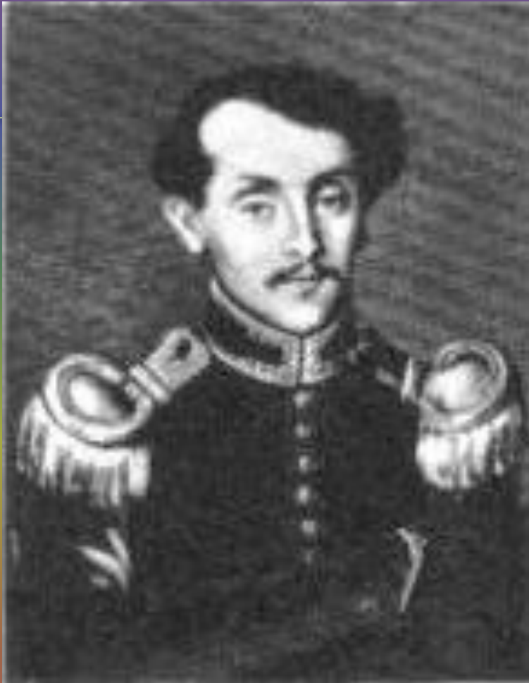
Николай Ильич, отец Л.Н.Толстого